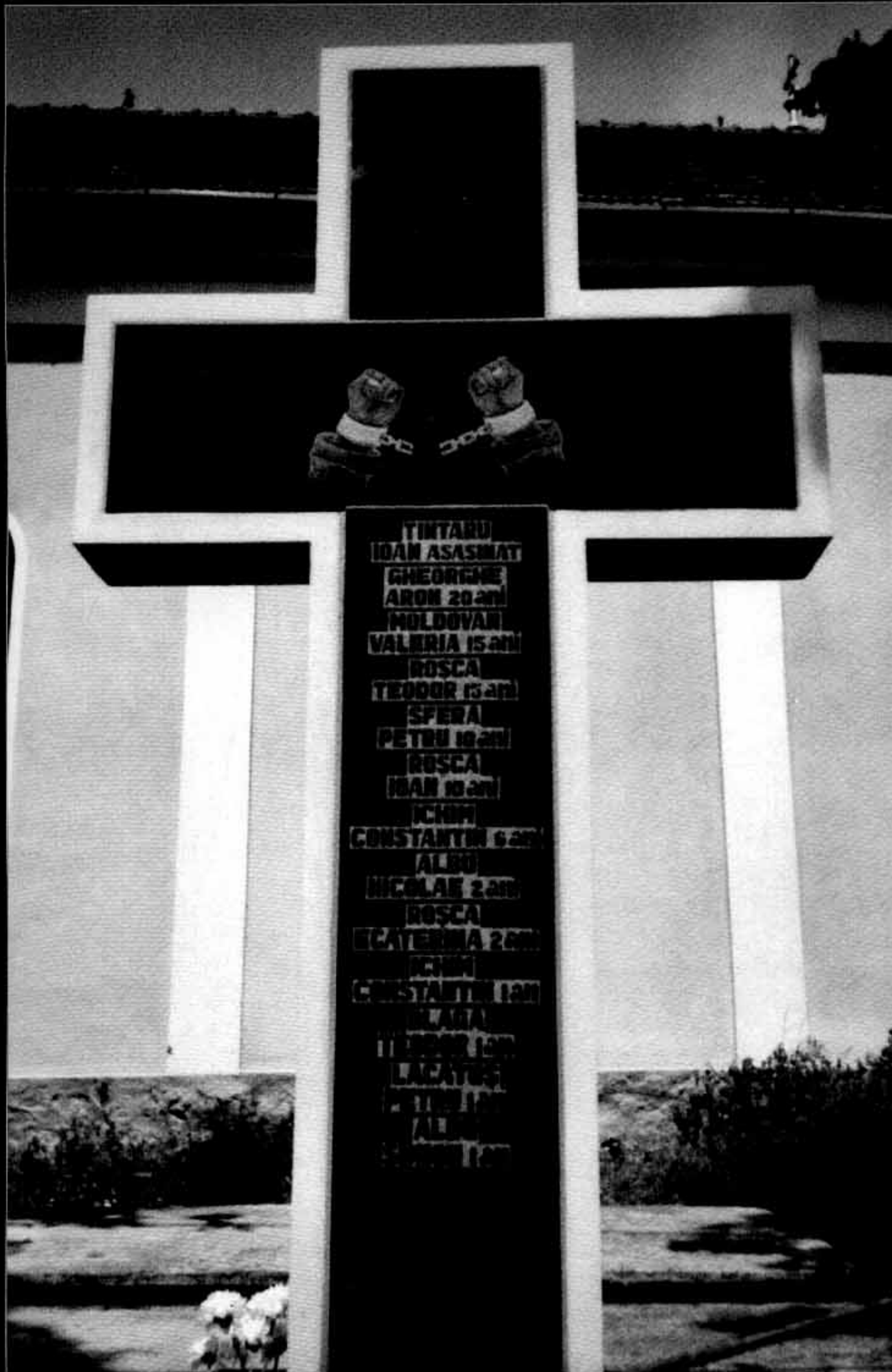
Crucea monument de la Gurghiu - satul Adrian

A fost sfințită de un sobor de preoți catolici și greco-catolici la 21 martie 2004, prin grija Filialei AFDPR Târgu-Mureș.