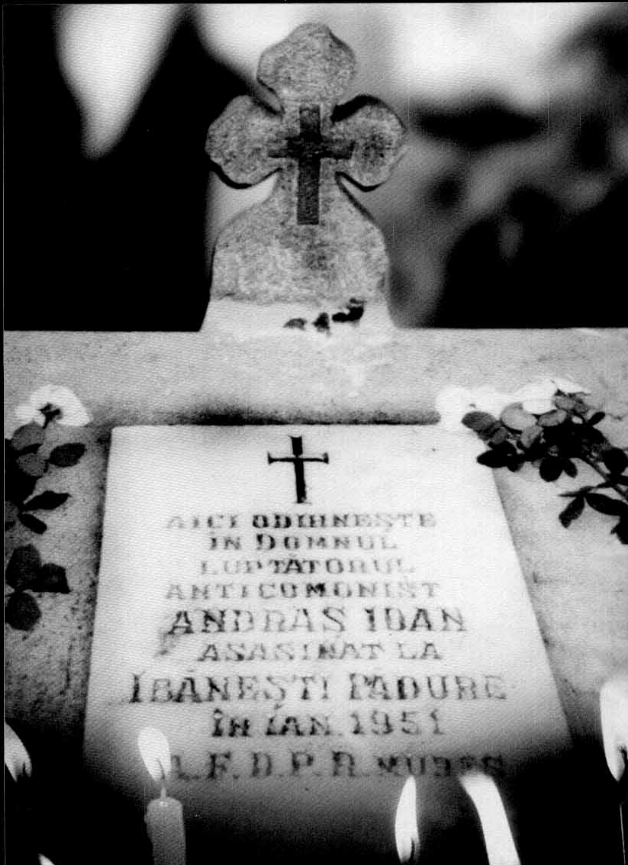
Monumentul martirului de la Ibănești