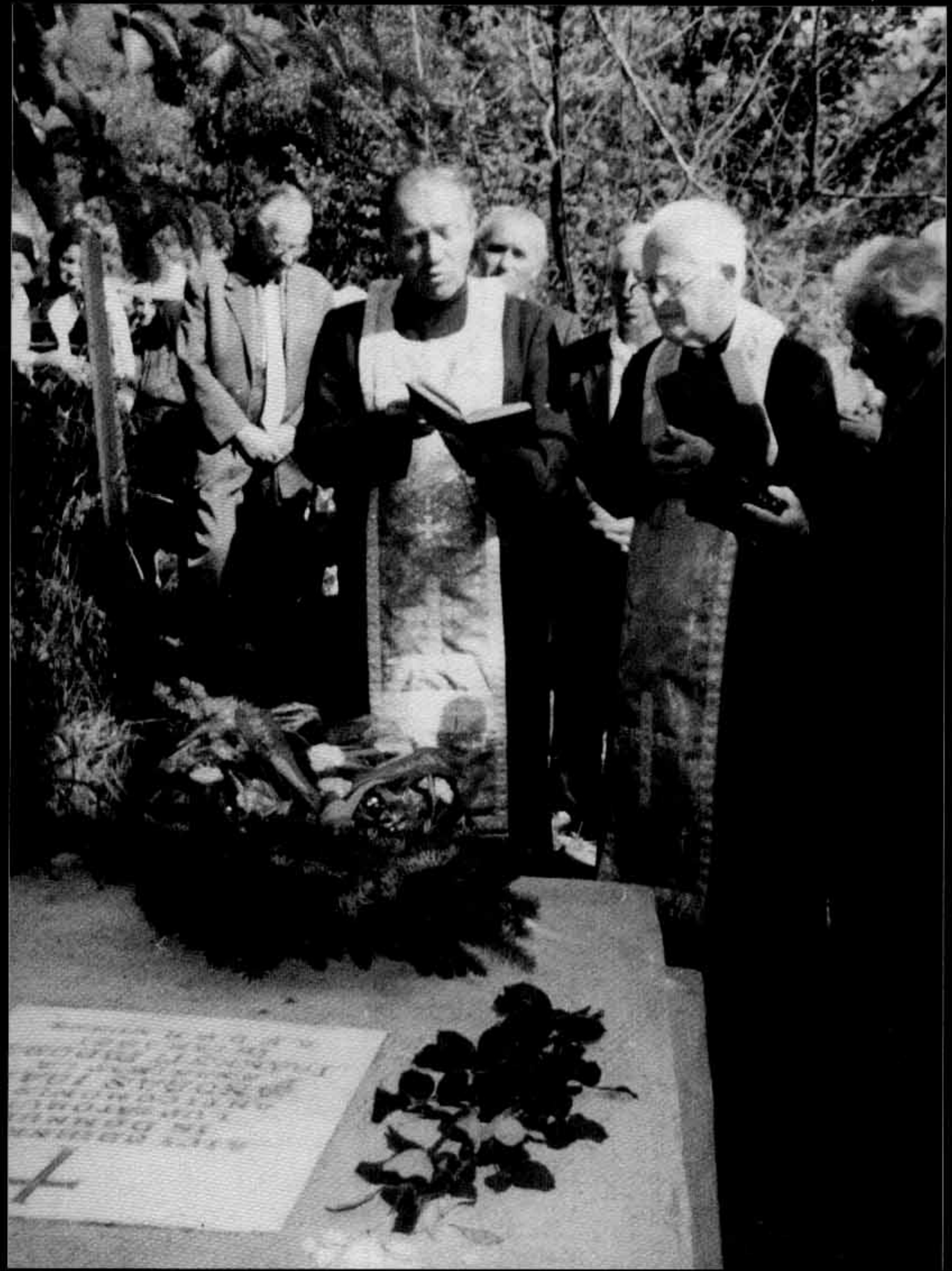
Monumentul martirului Țintaru