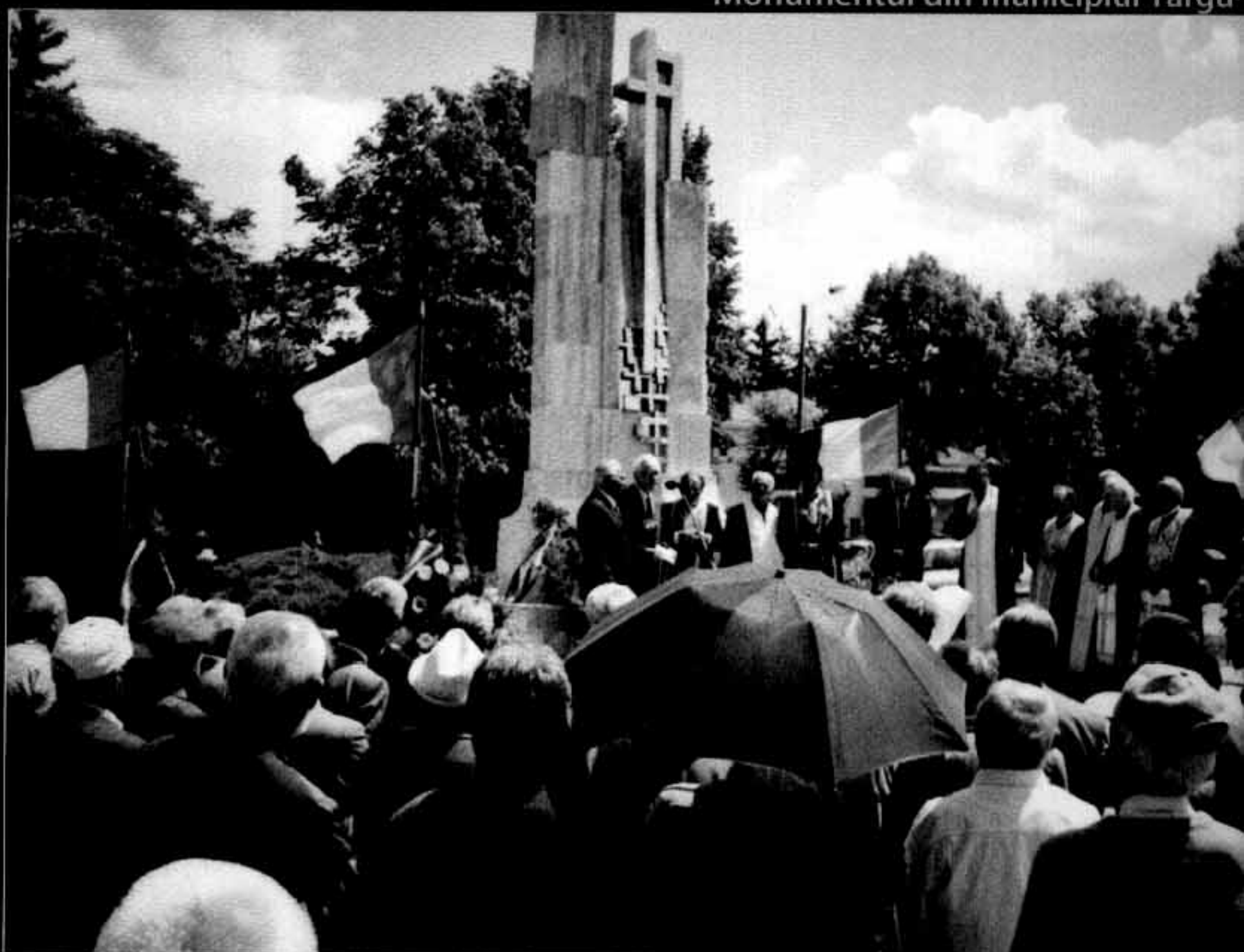
Monumentul din municipiul Târgu-