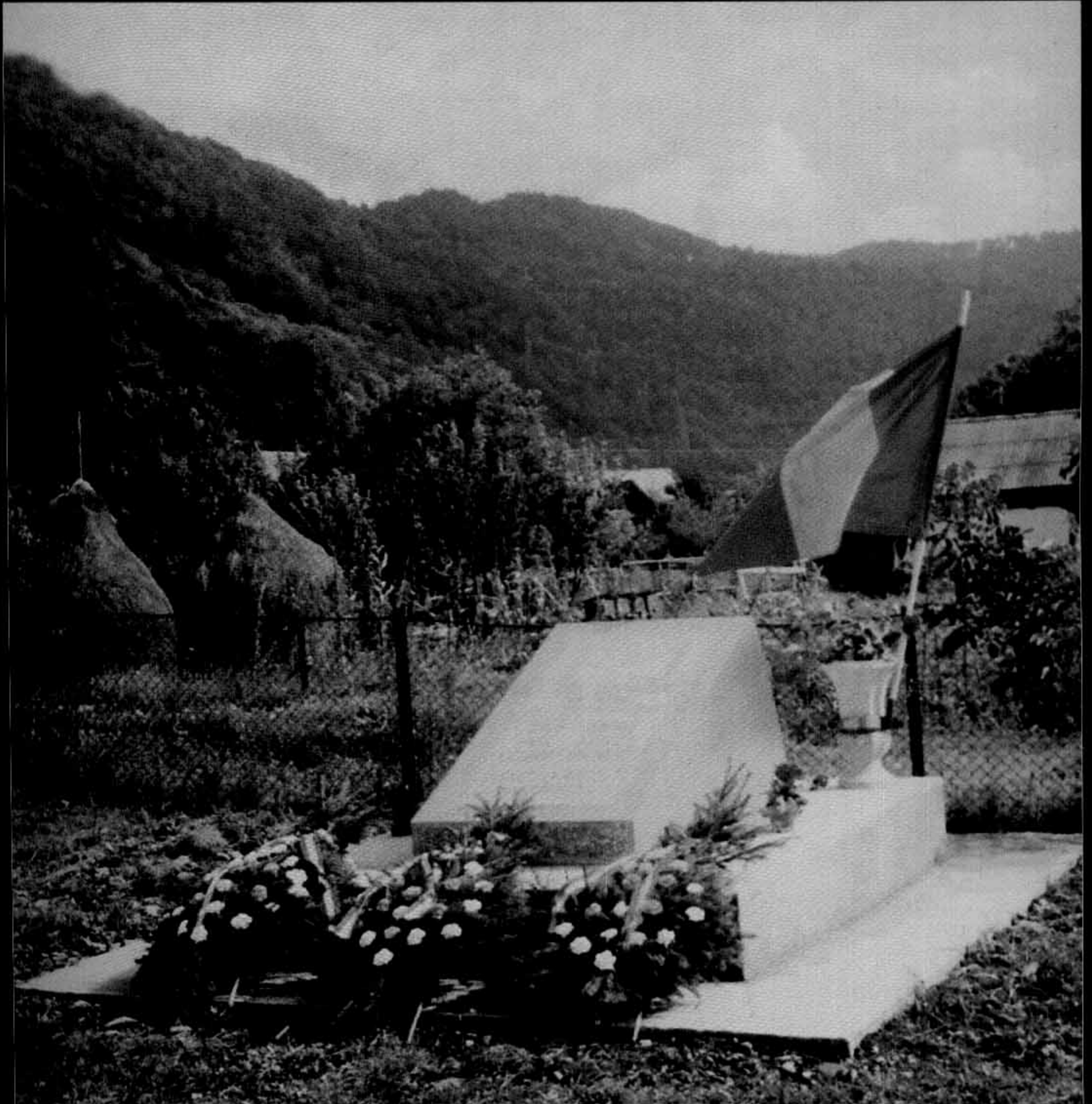
Monumentul eroilor-martiri de la Răstolnița