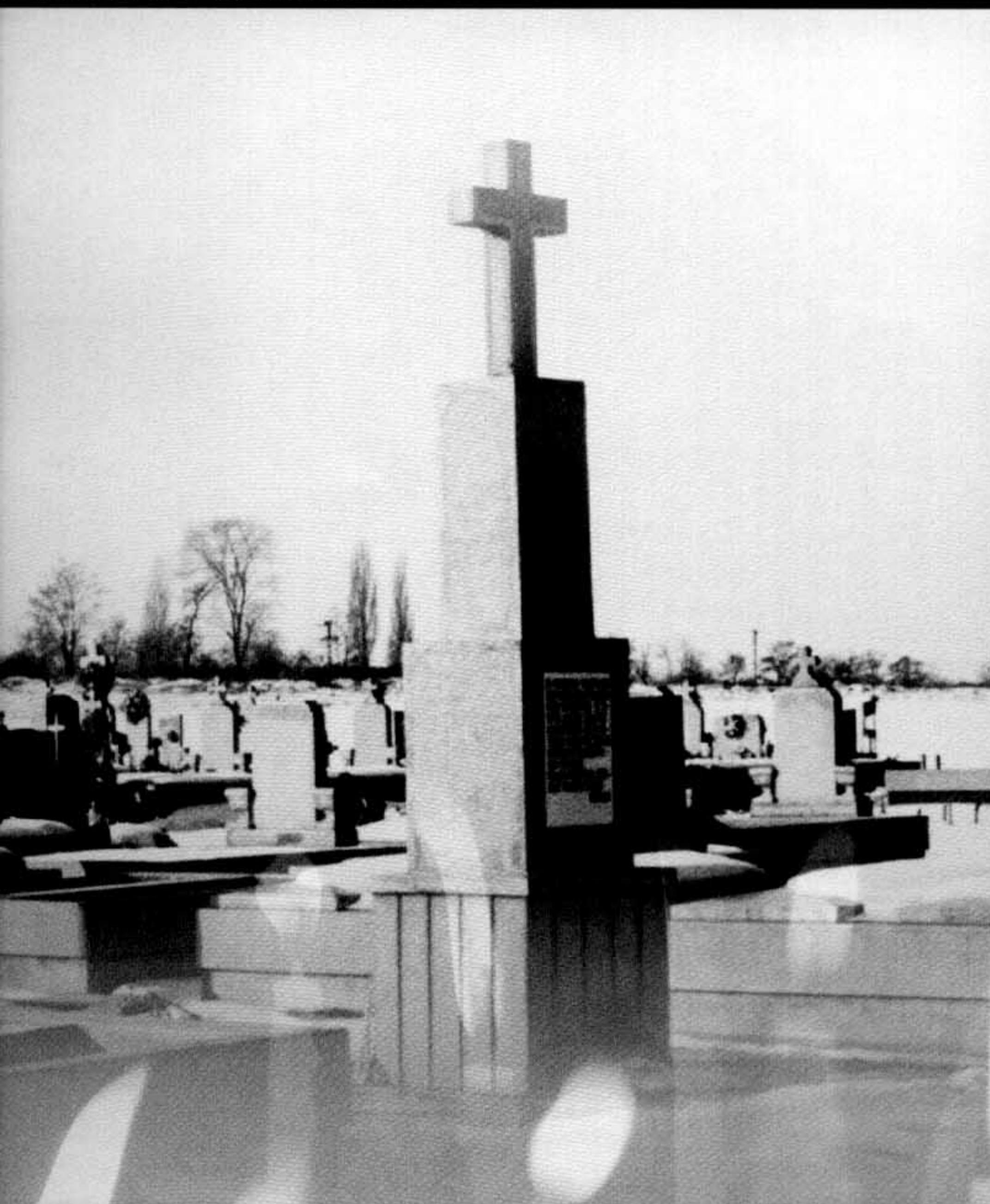
Monumentul din cimitirul Oradea