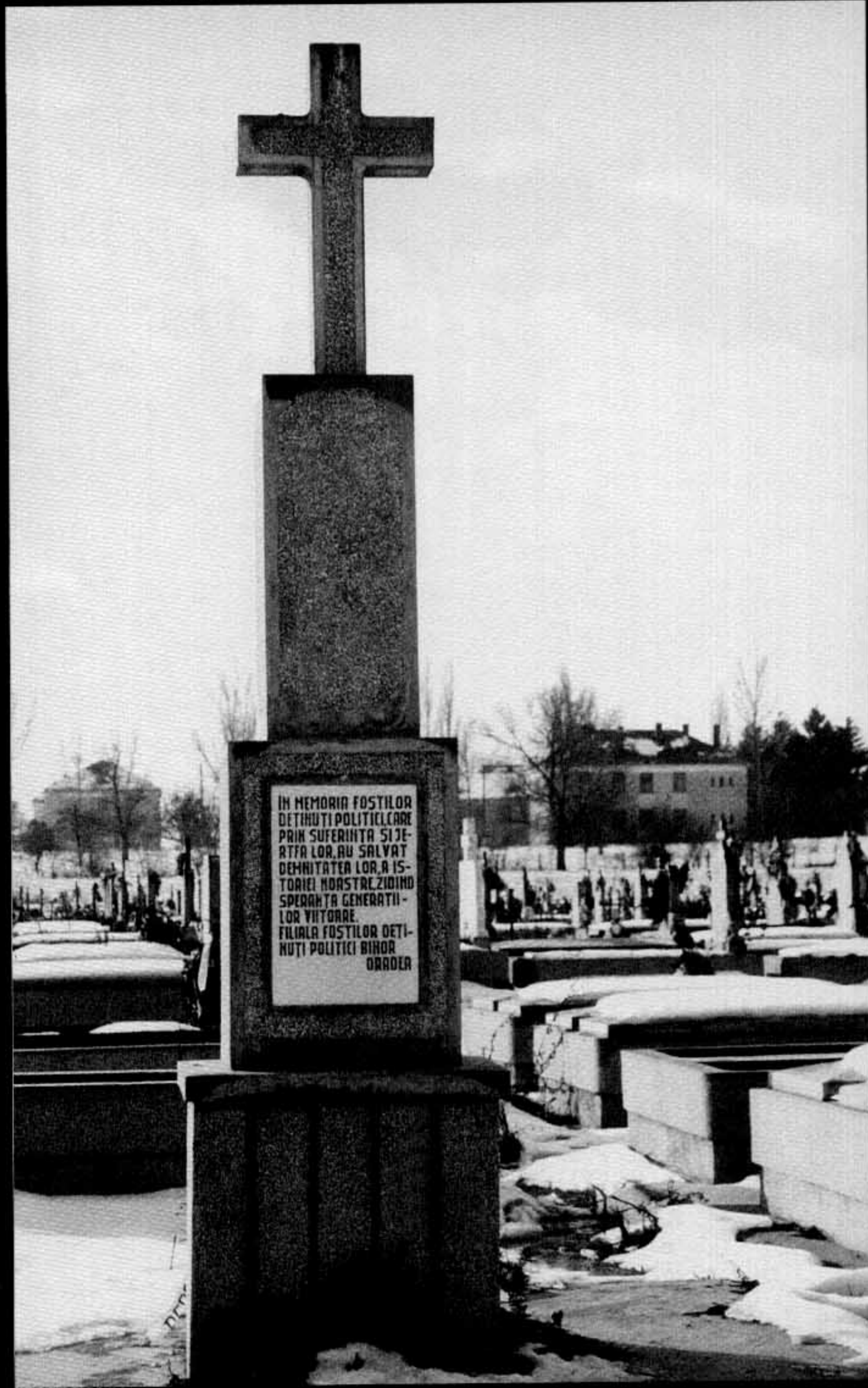
Monumentul din cimitirul de la Oradea