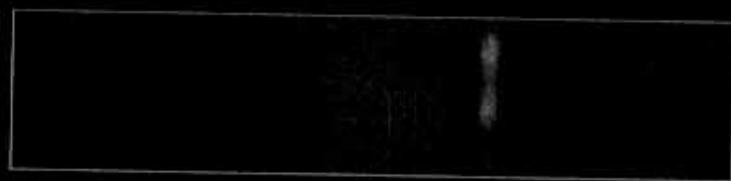
Memorialul de la Pitești