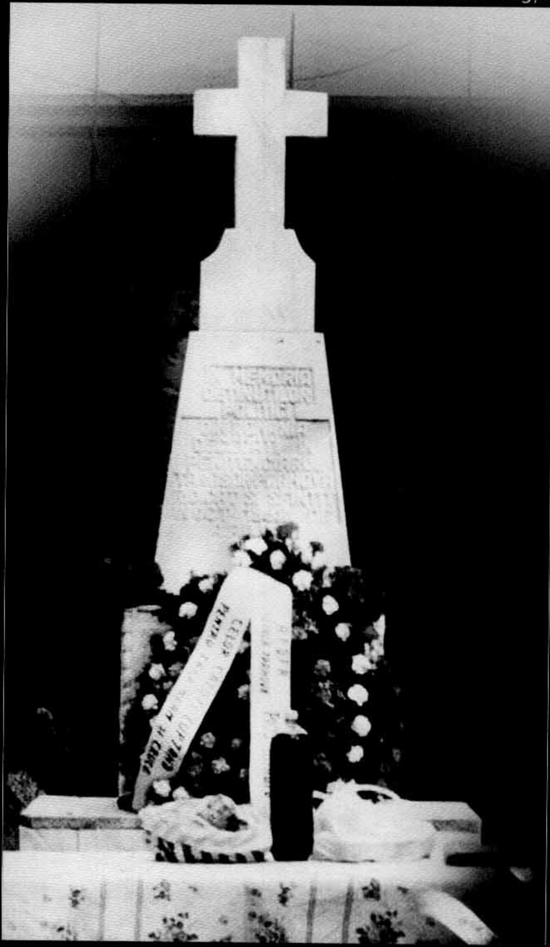
Monumentul de la Târgșor