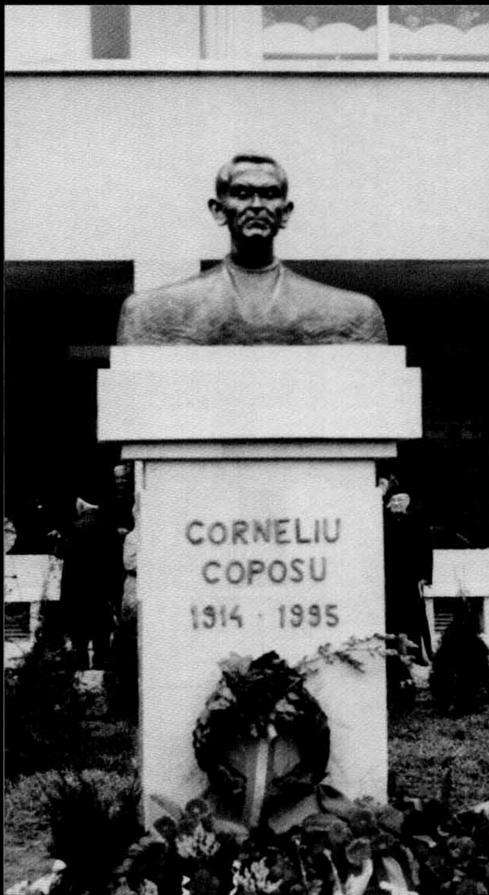
Bustul lui Corneliu Coposu