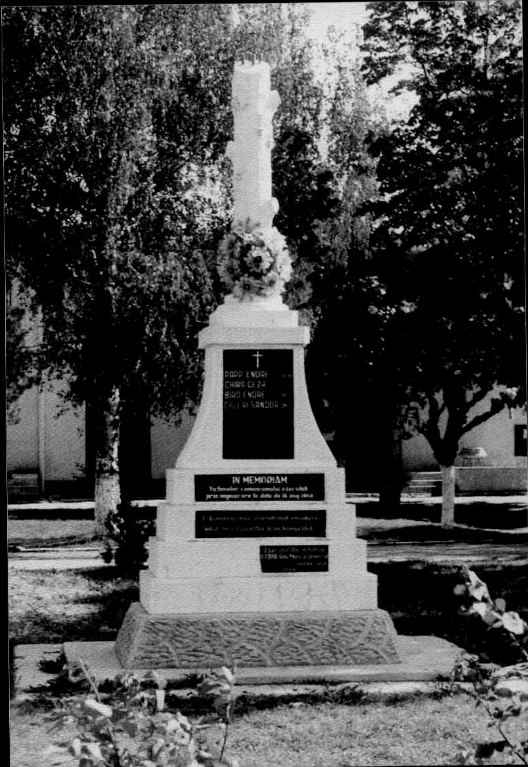
Monumentul de la Odoreu