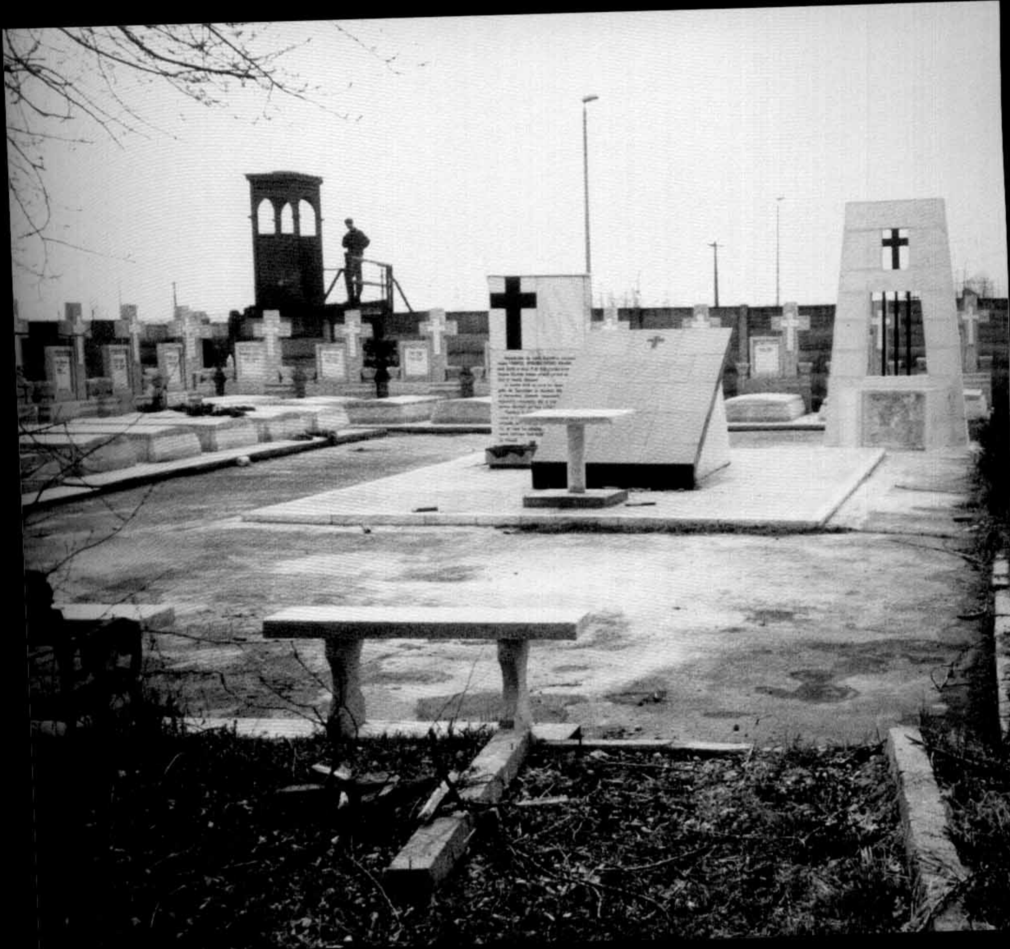
Memorialul de la Sibiu