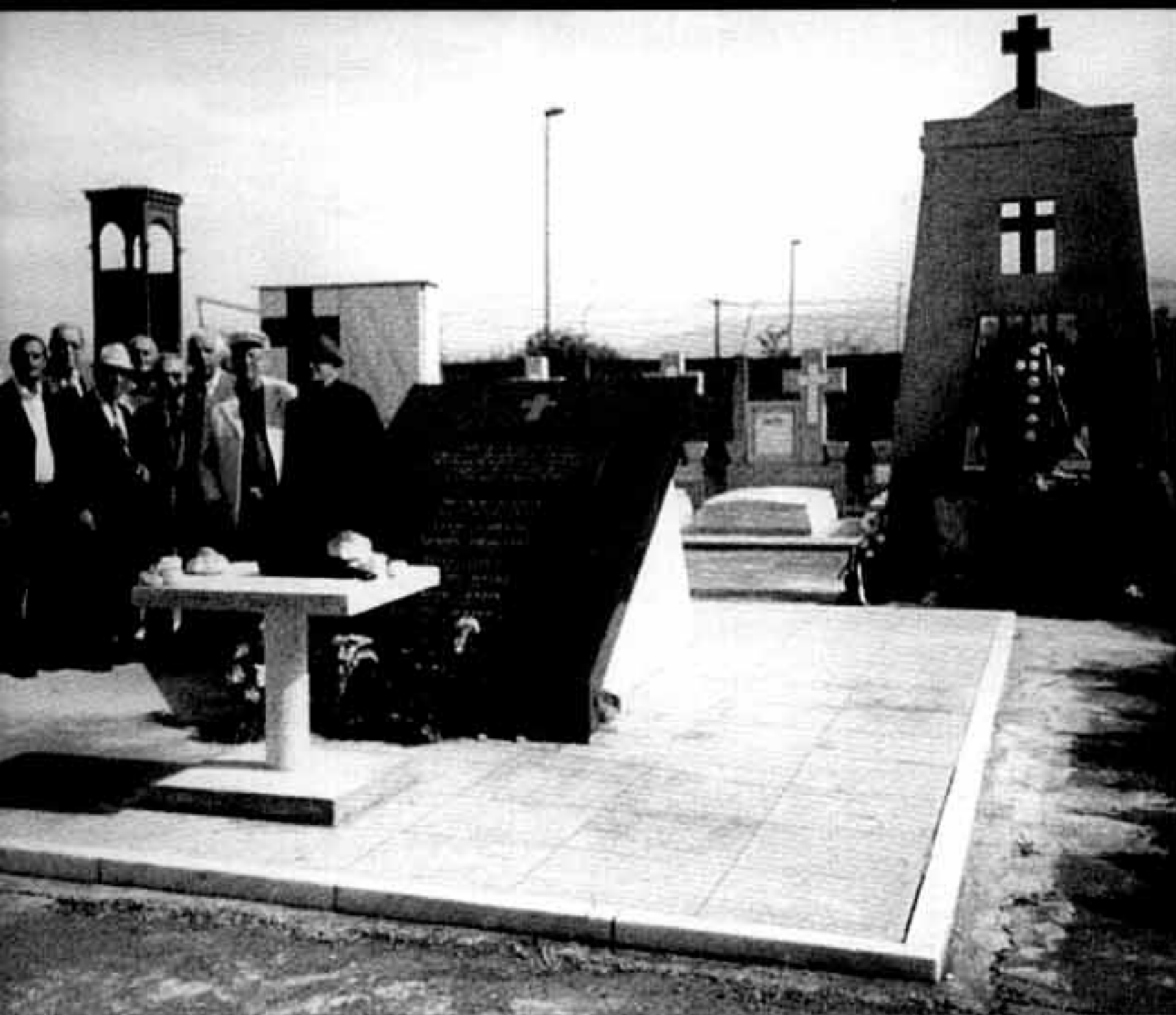
Momentul sfințirii, iunie 2004