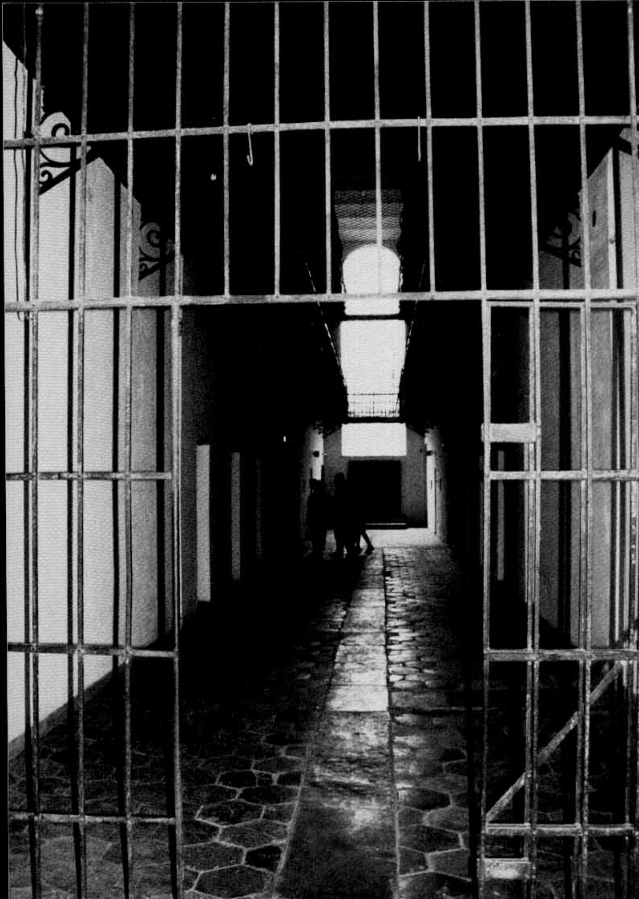
Închisoarea Sighet - celularul de la parter