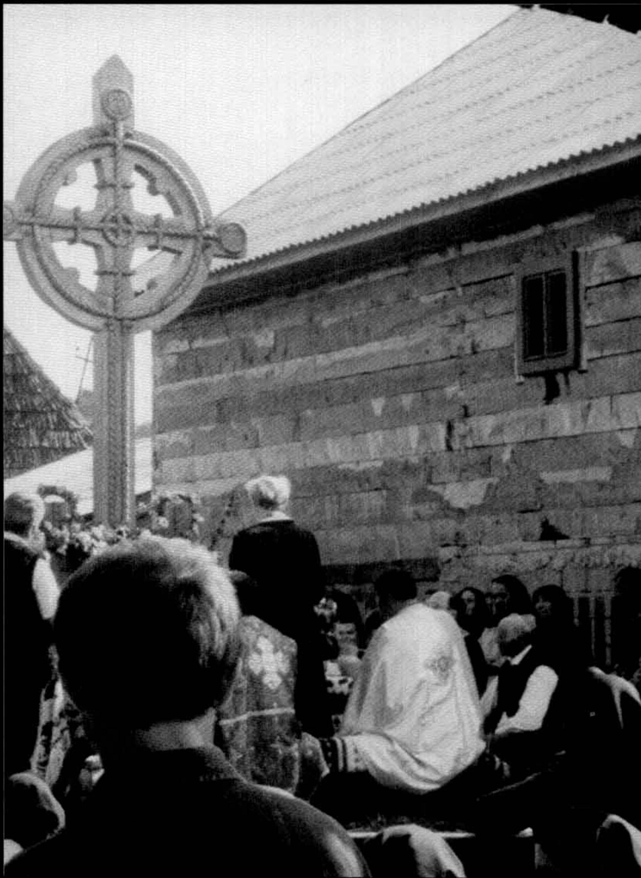
Monumentul din leud