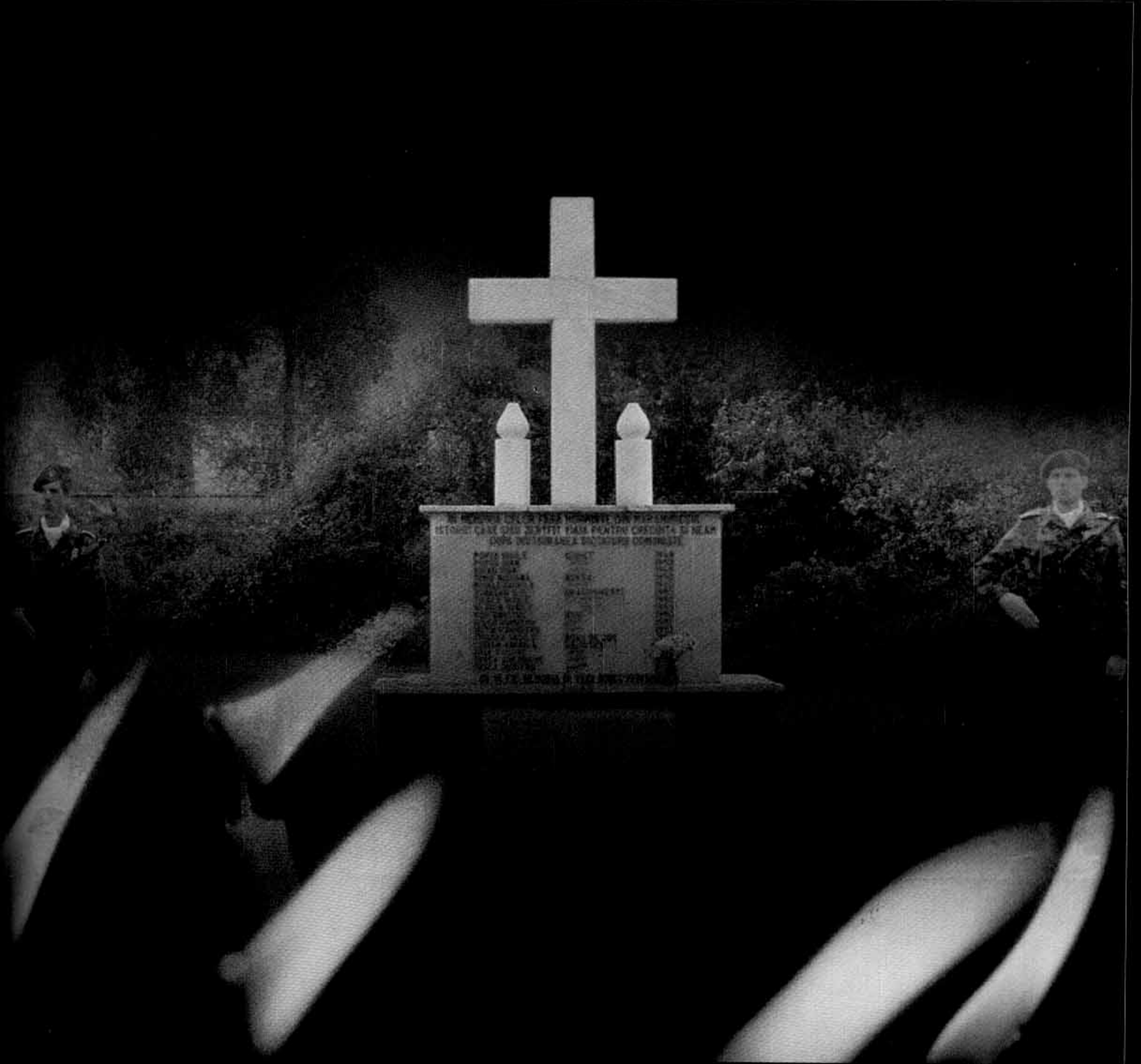
Monumentul din Cimitirul Săracilor, Sighet