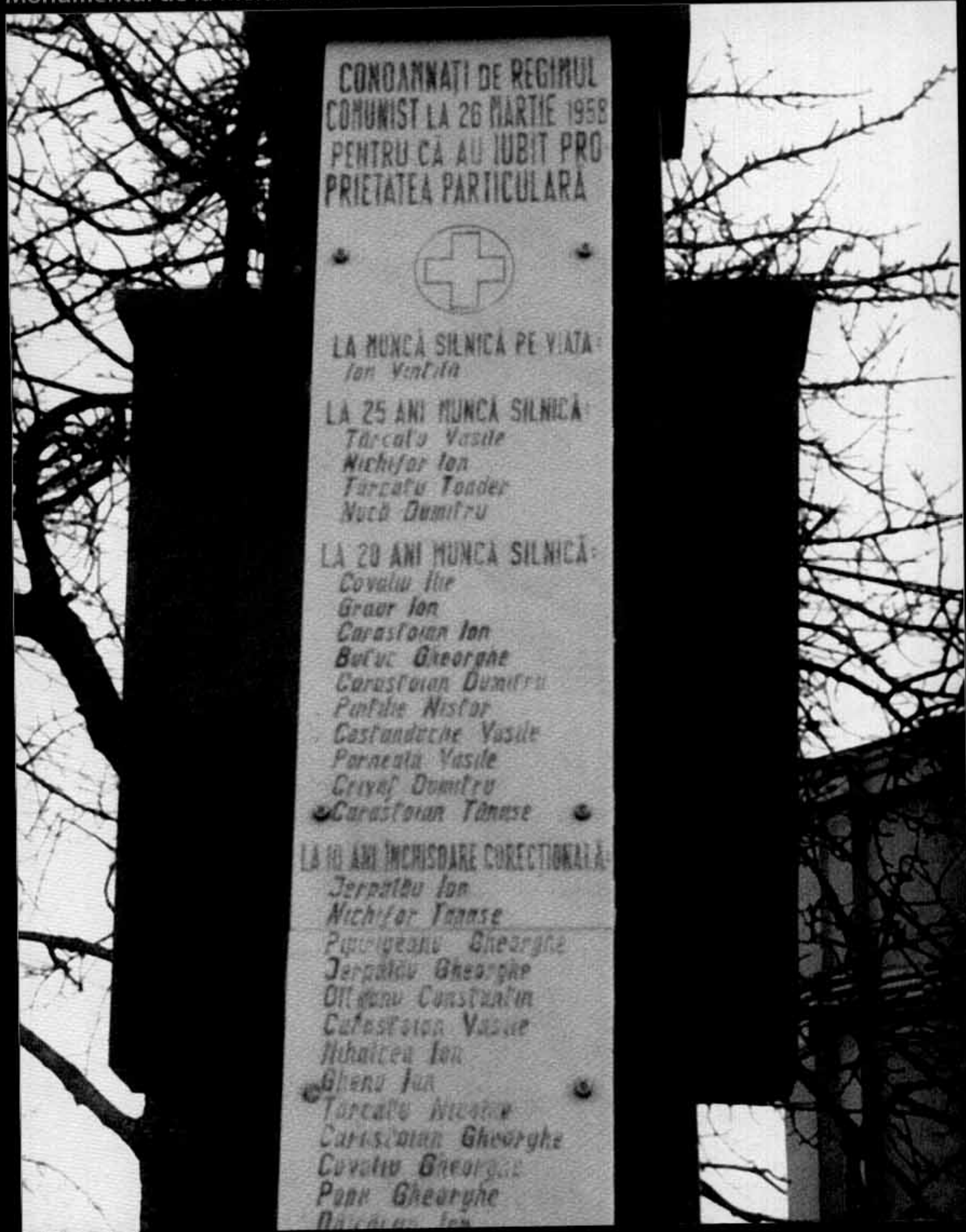
Monumentul de la Meidanchioi