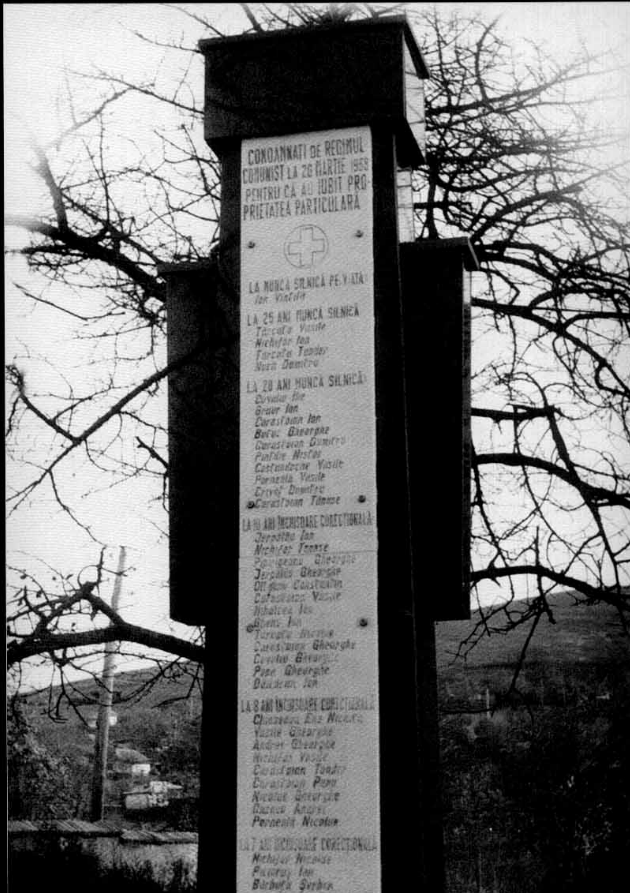
Monumentul de la Meidanchioi