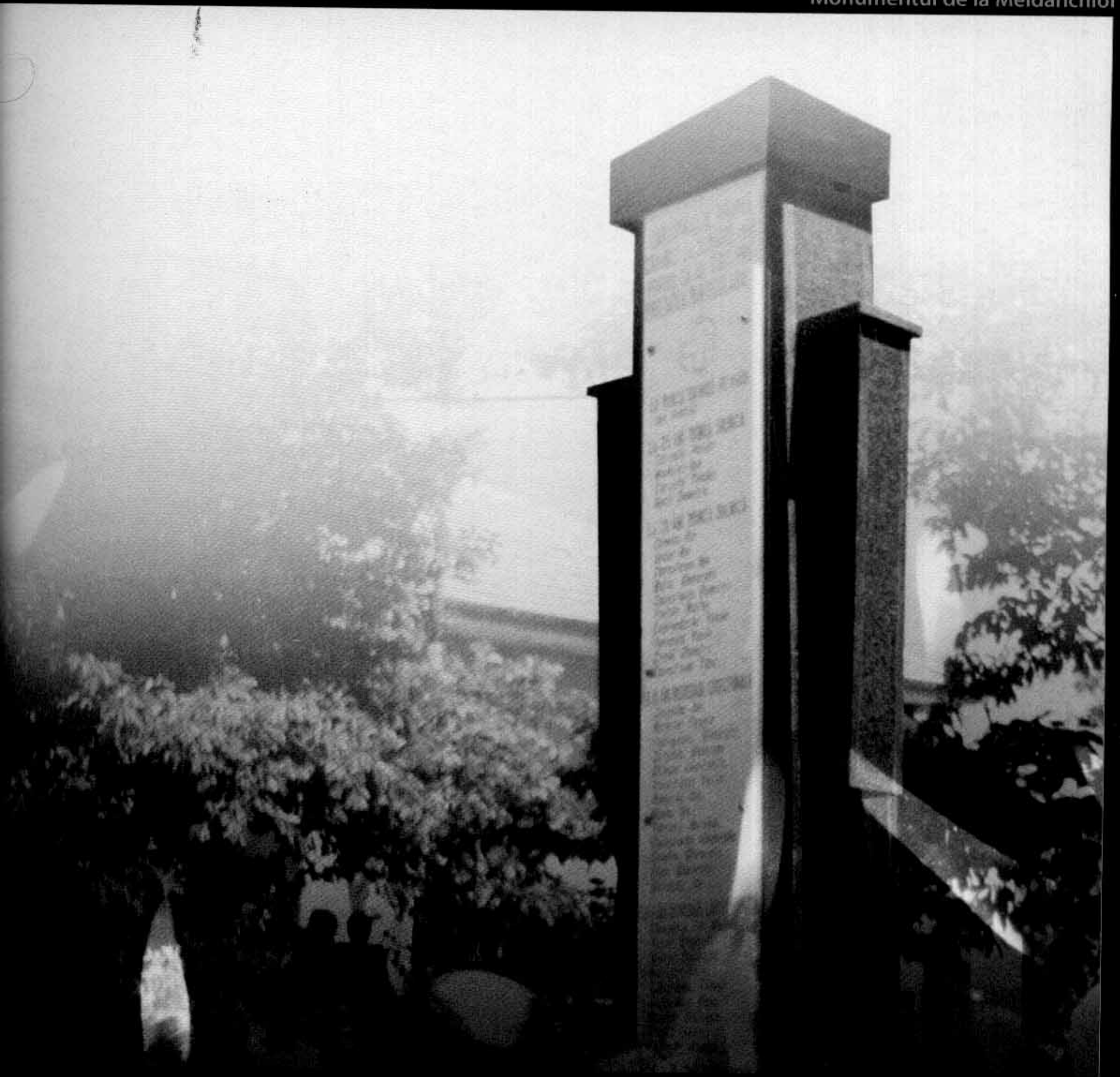
Monumentul de la Meidanchioi