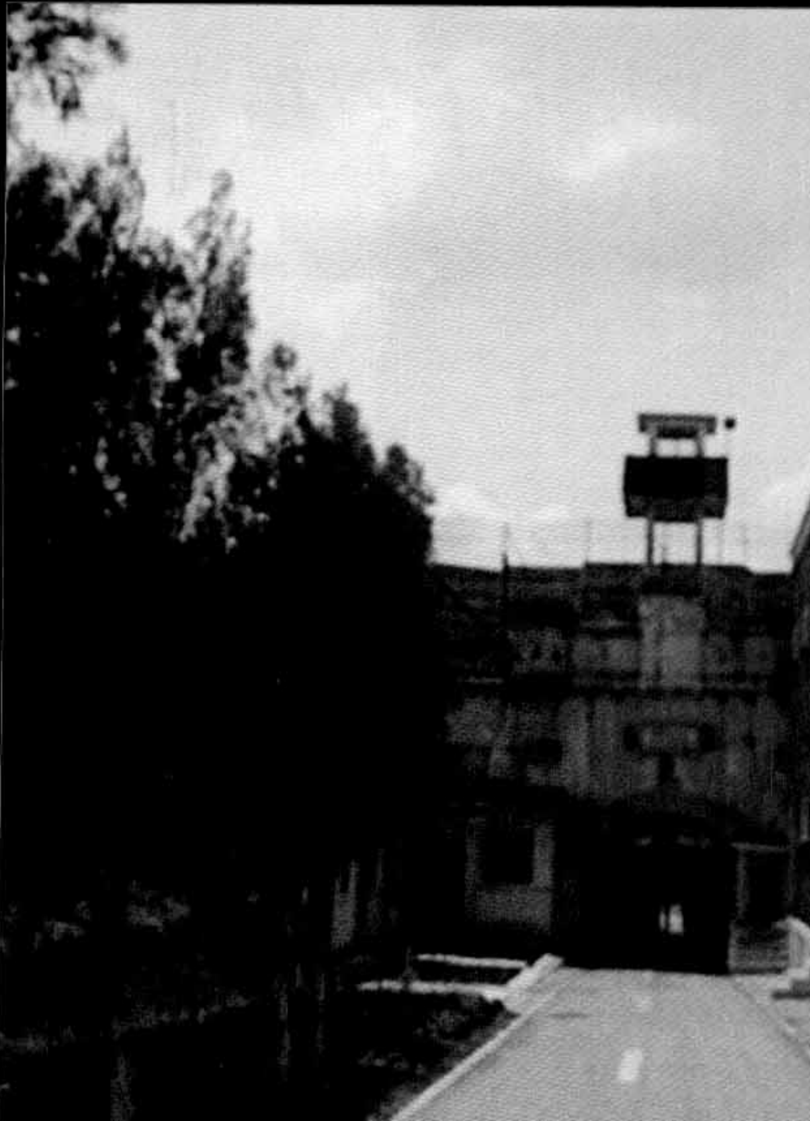
Intrarea în Fortul 13, Jilava