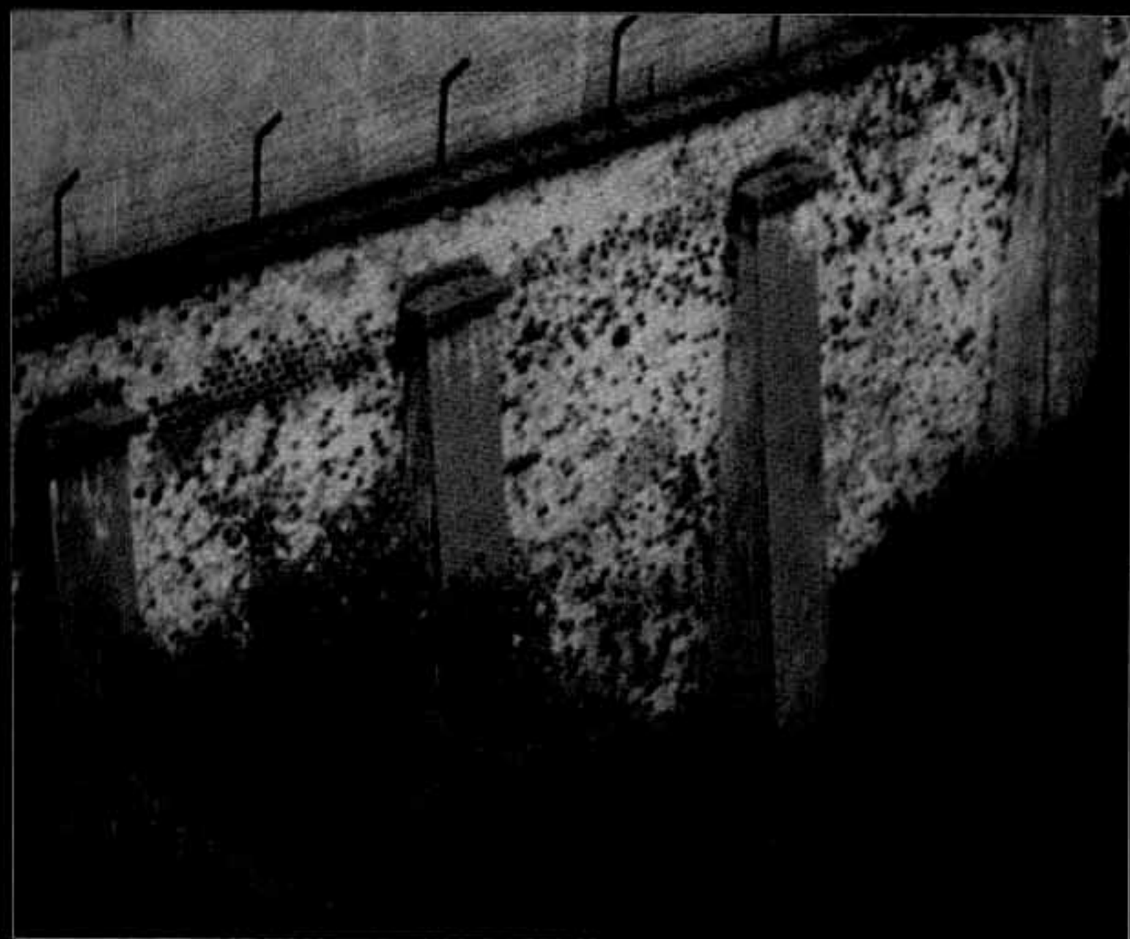
Celular de la închisoarea J