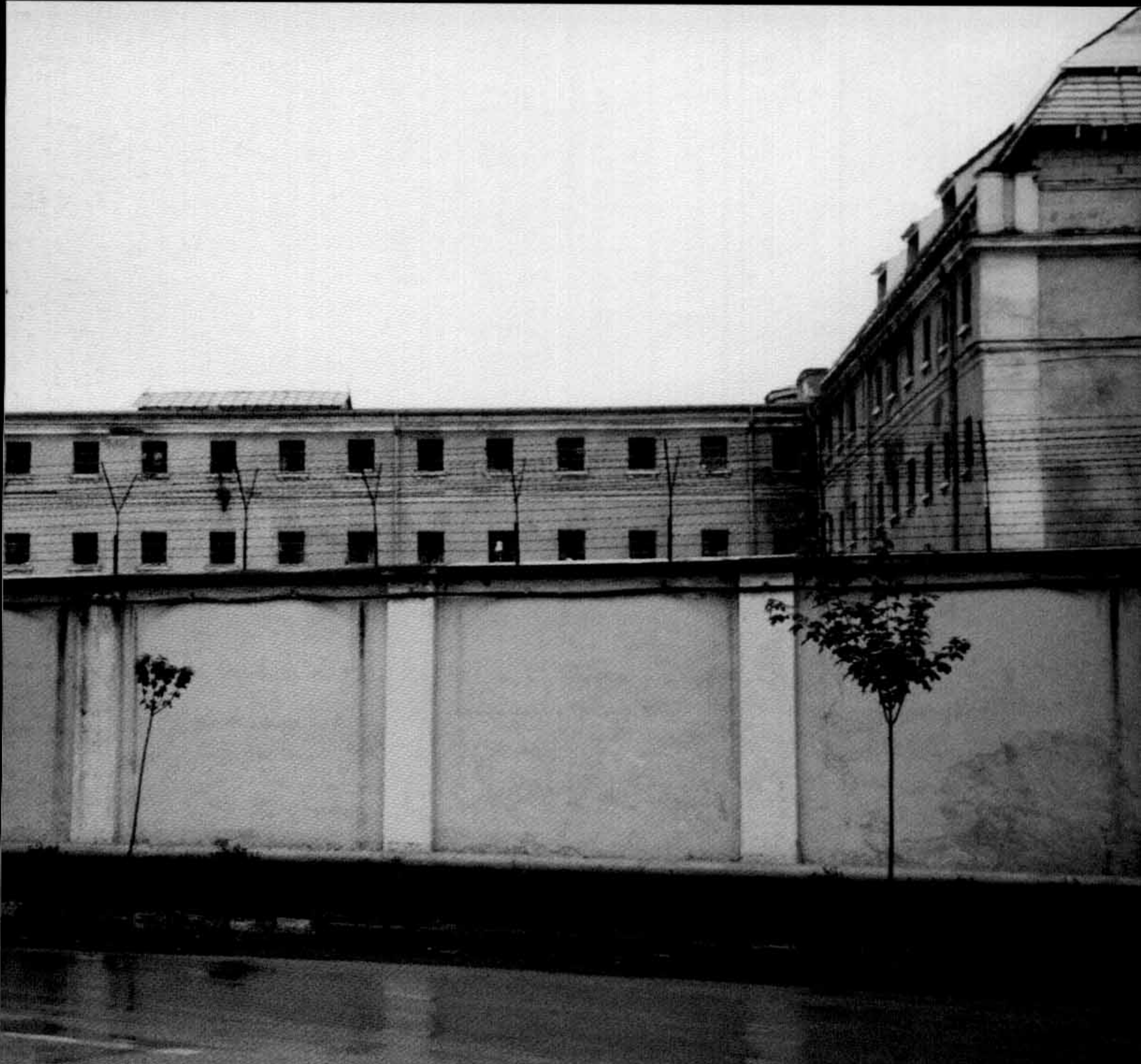
Intrarea în închisoarea Aiud. Vedere de ansamblu