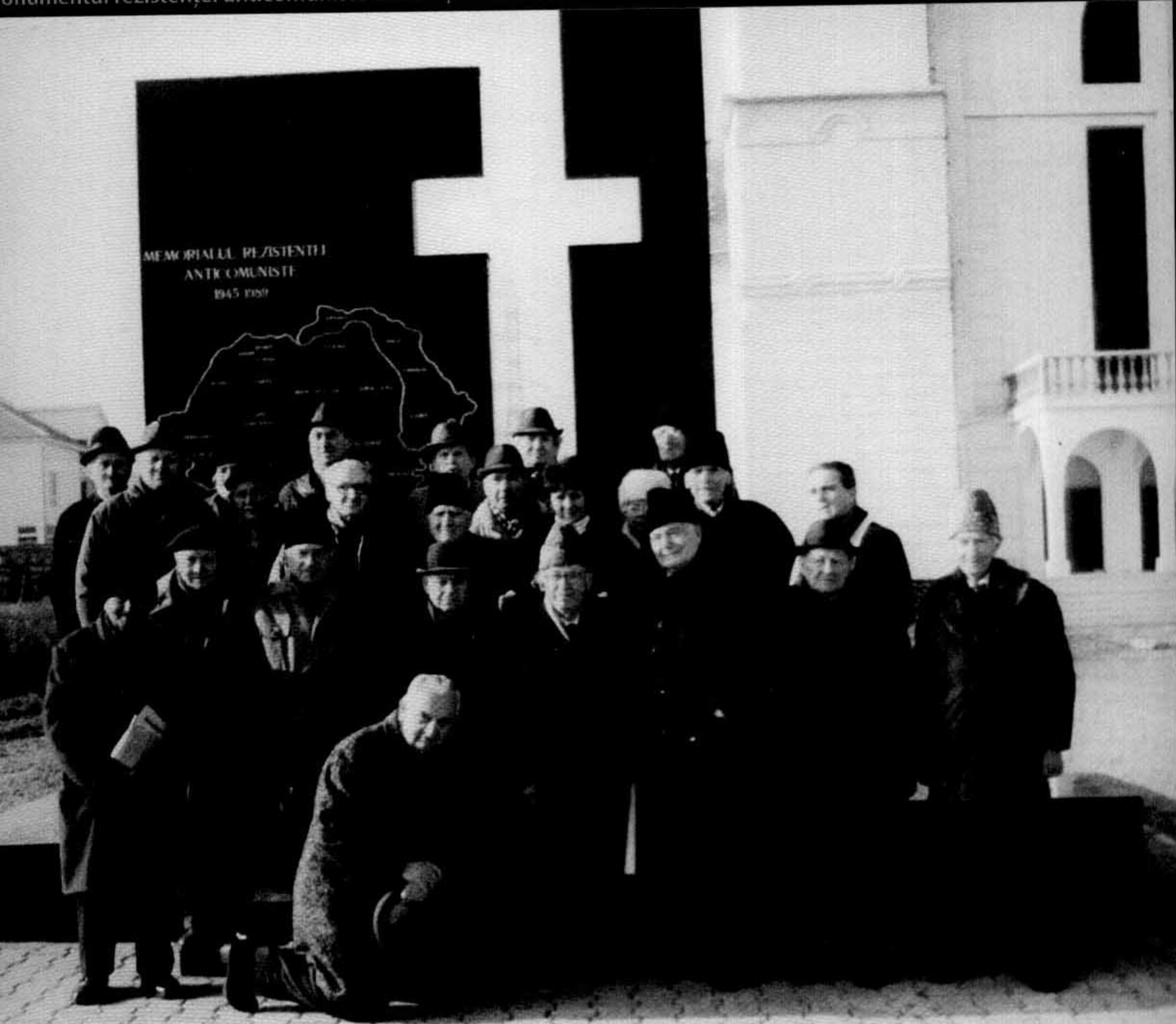
Monumentul rezistenței anticomuniste din orașul Alba Iulia