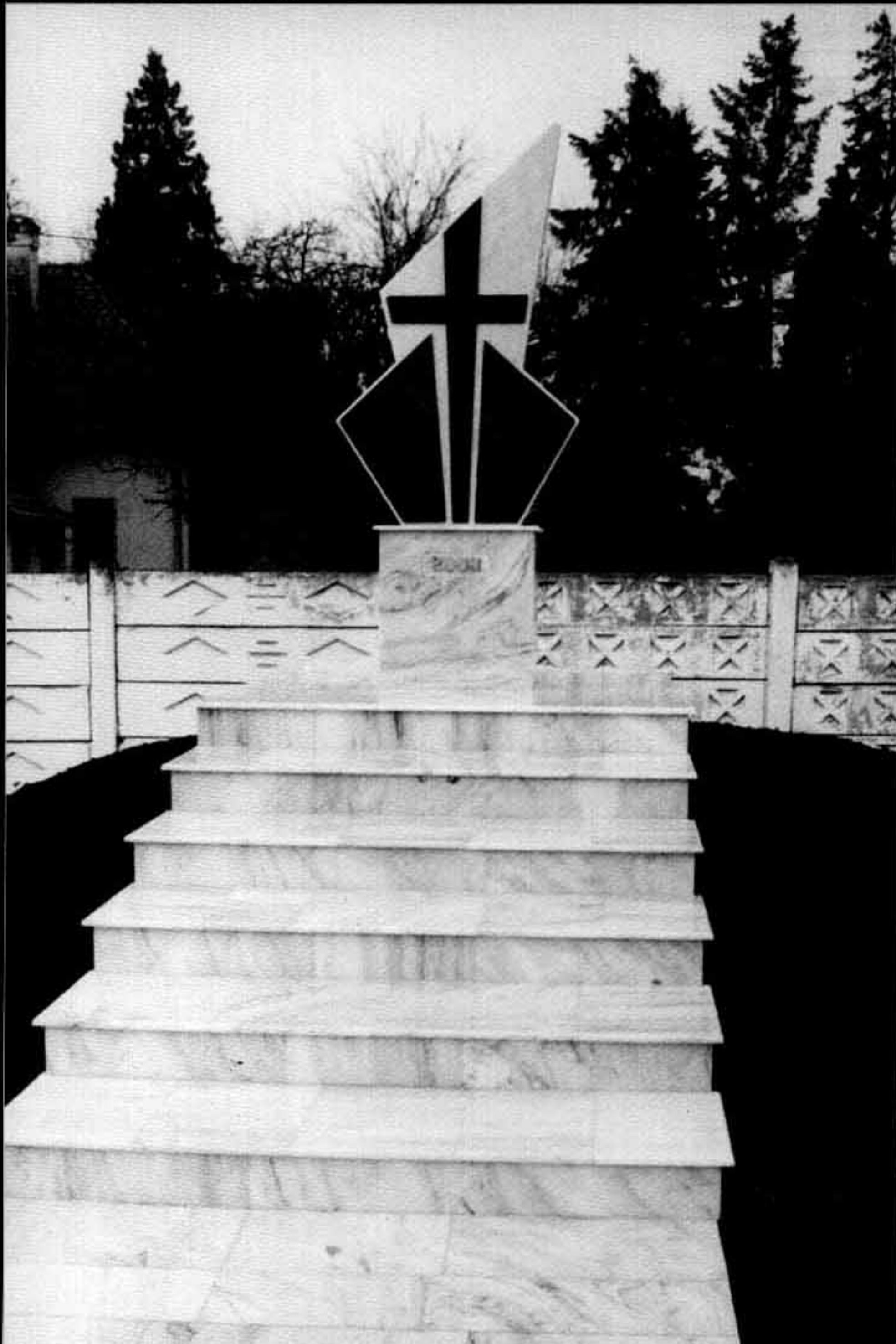
Monumentul de la Cugir