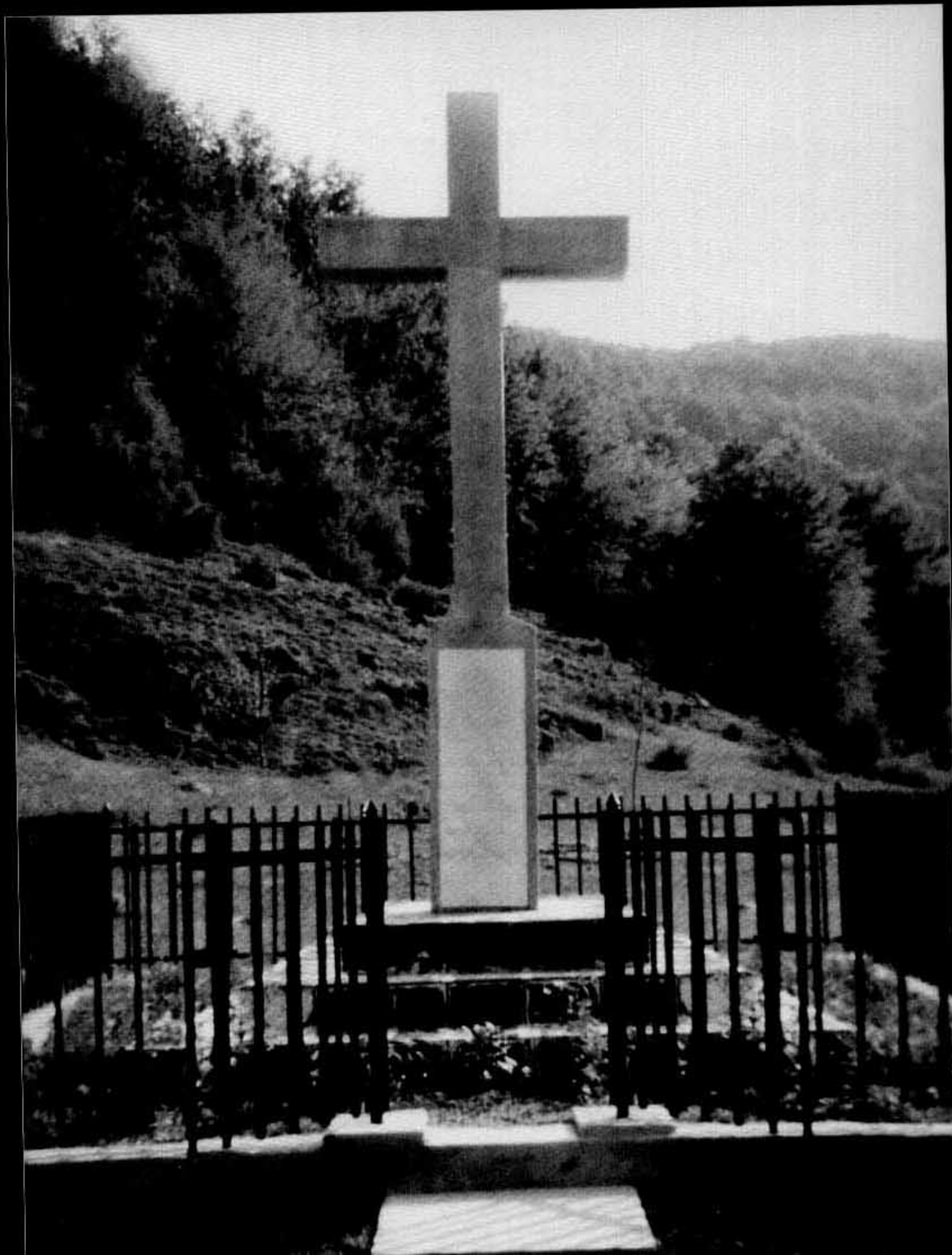
Monumentul de la Chisindia-Arad