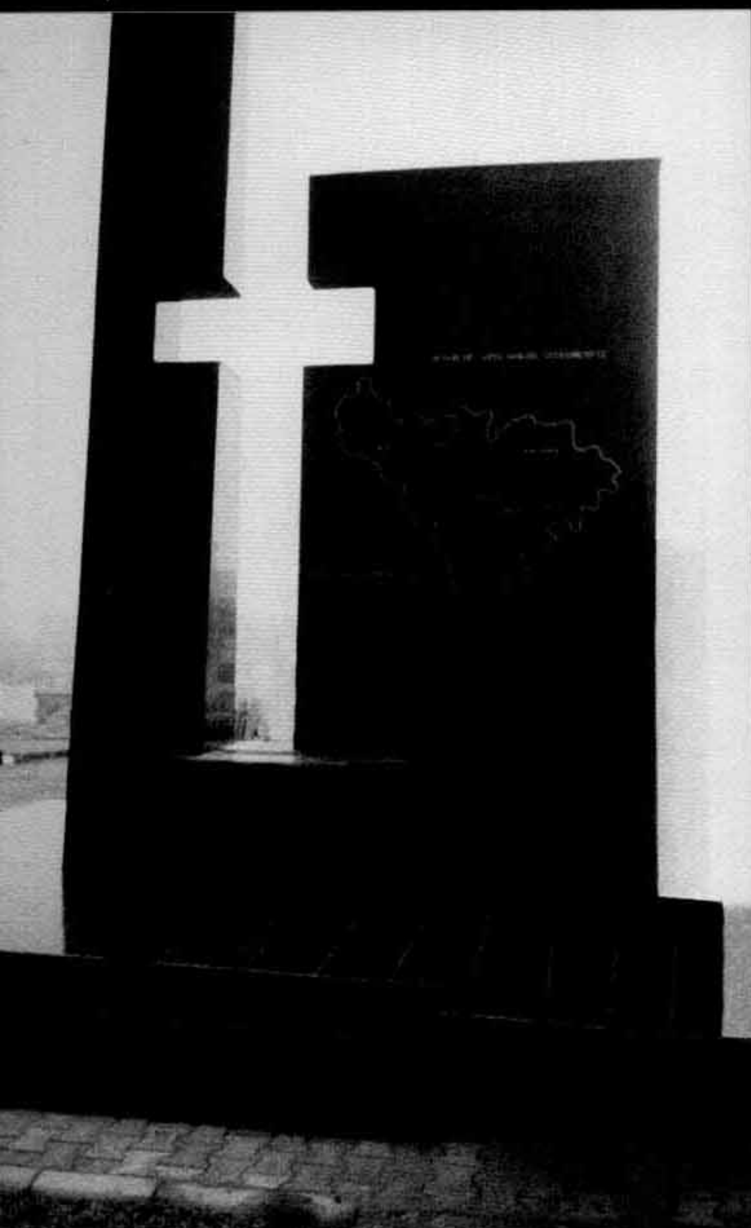
Monumentul rezistenței anticomuniste din orașul Alba Iulia