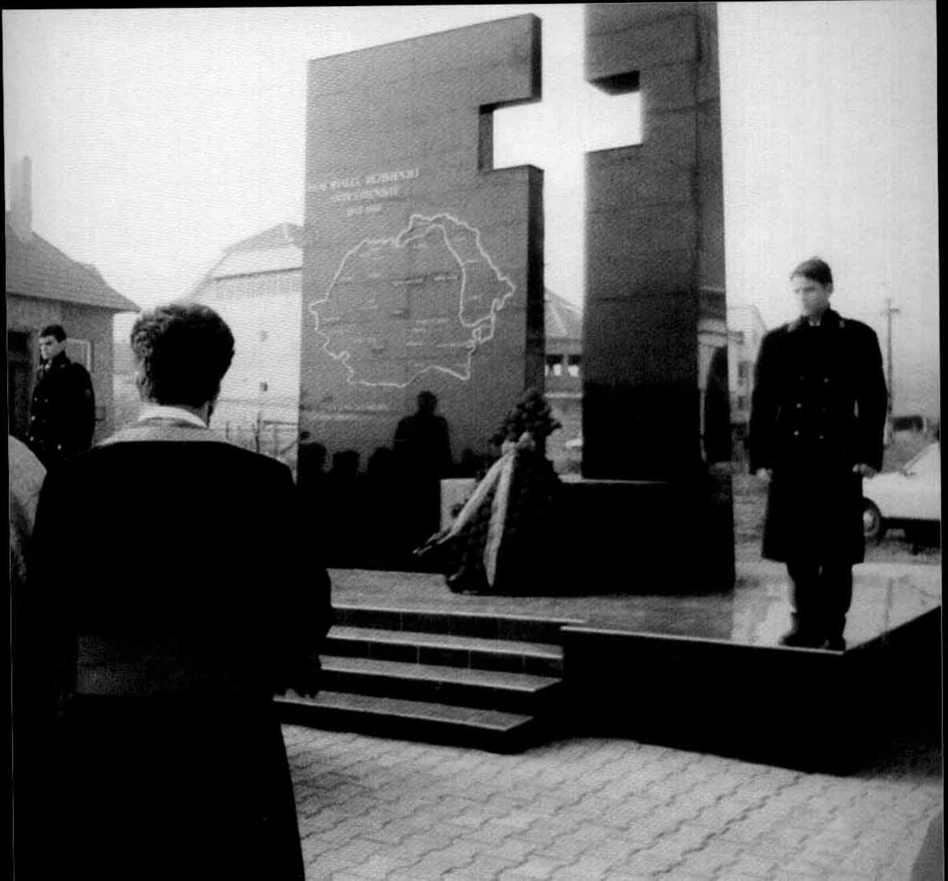
Monumentul rezistenței anticomuniste din orașul Alba Iulia