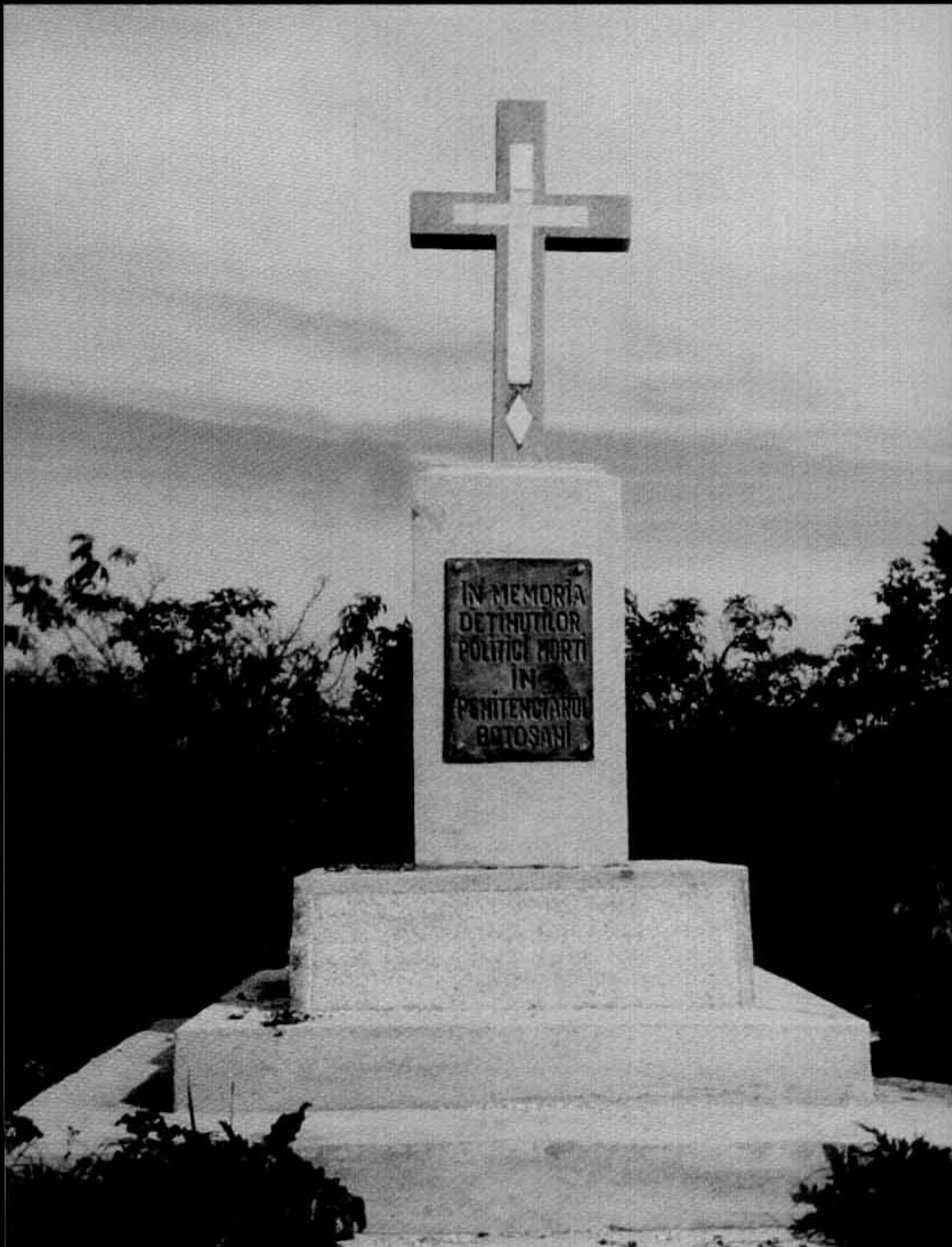
Monumentul de la Botoșani