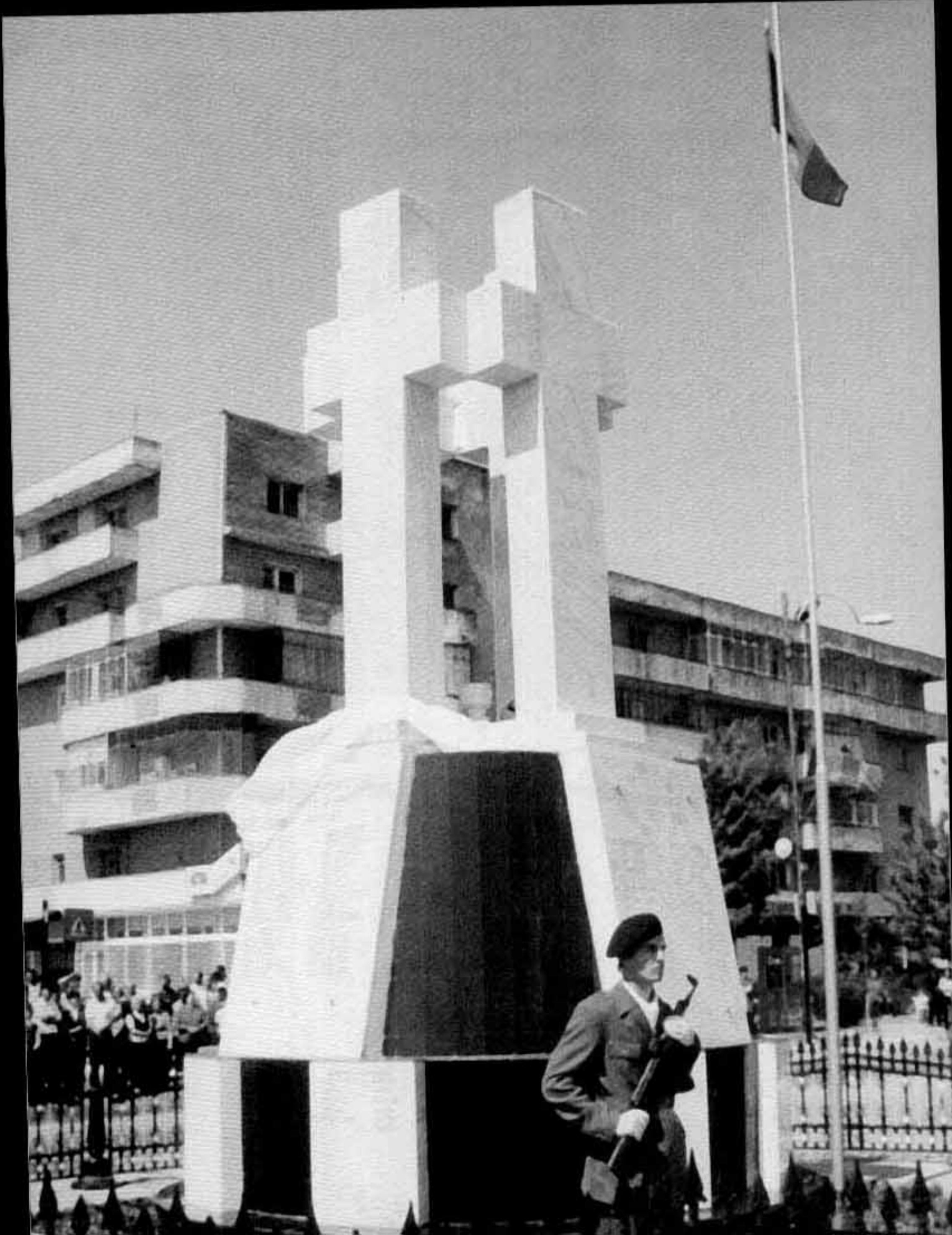
Monumentul de la Călărași