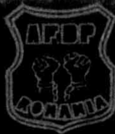
Placa comemorativă de la fosta închisoare Brașov

DEZVELIM ACEASTĂ PLACĂ ÎN AMINTIREA LUPTĂTORILOR PENTRU LIBERTATE ÎNTEMNITAȚI ÎN ACEASTĂ CLĂDIRE ÎN ANII TERORII COMUNISTE