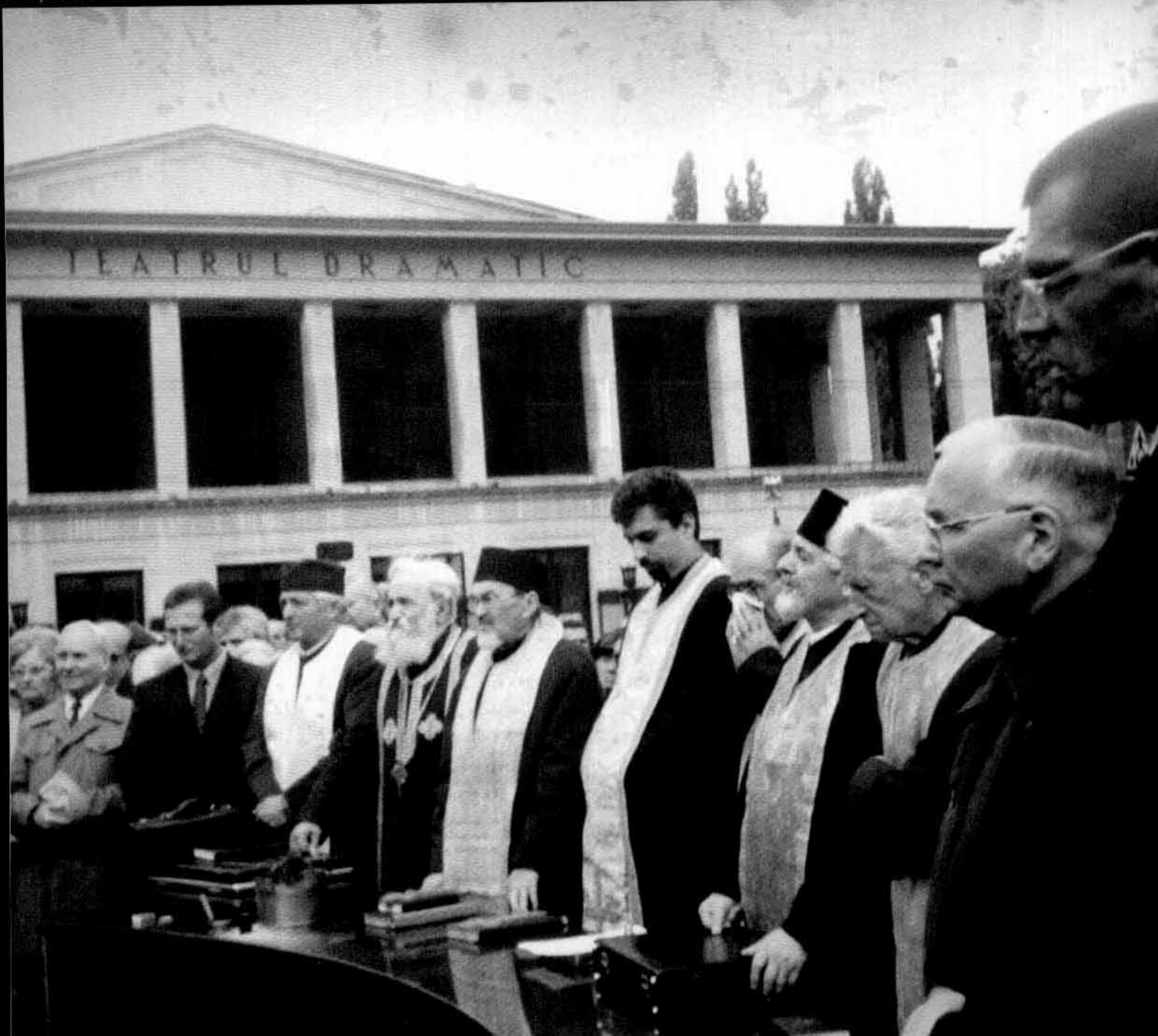
Sfințirea Memorialului de la Brașov