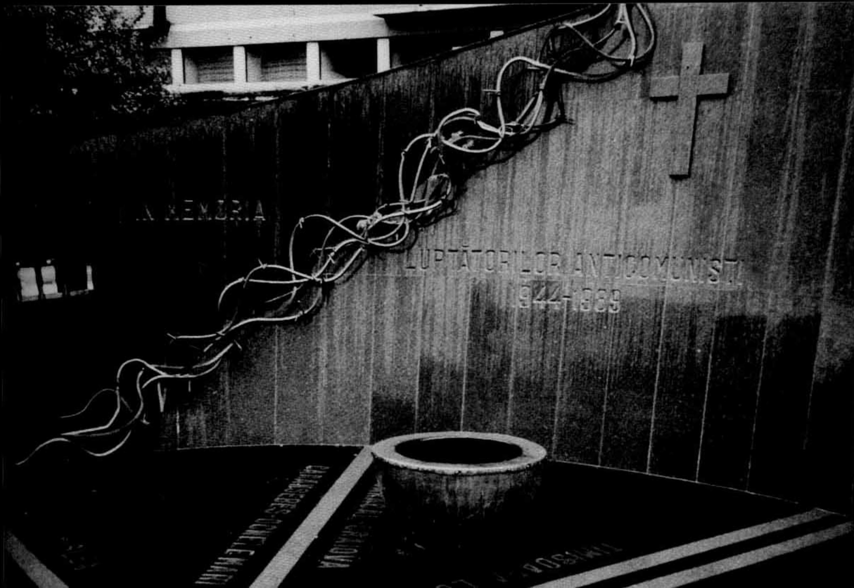
Memorialul de la Brașov