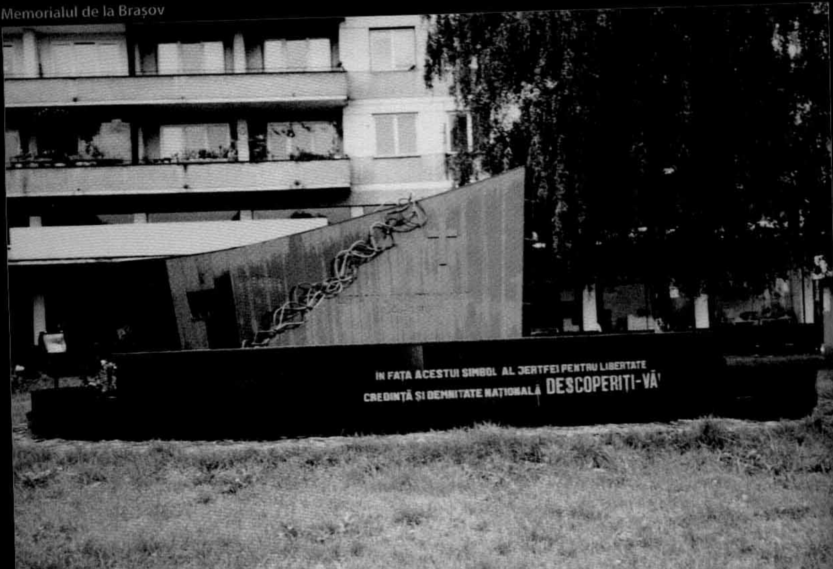
Memorialul de la Brașov

IN FAȚA ACESTUI SIMBOL AL JERTFEI PENTRU LIBERTATE CREDINȚĂ ȘI DEMNITATE NAȚIONALĂ DESCOPERIȚI-VĂ!