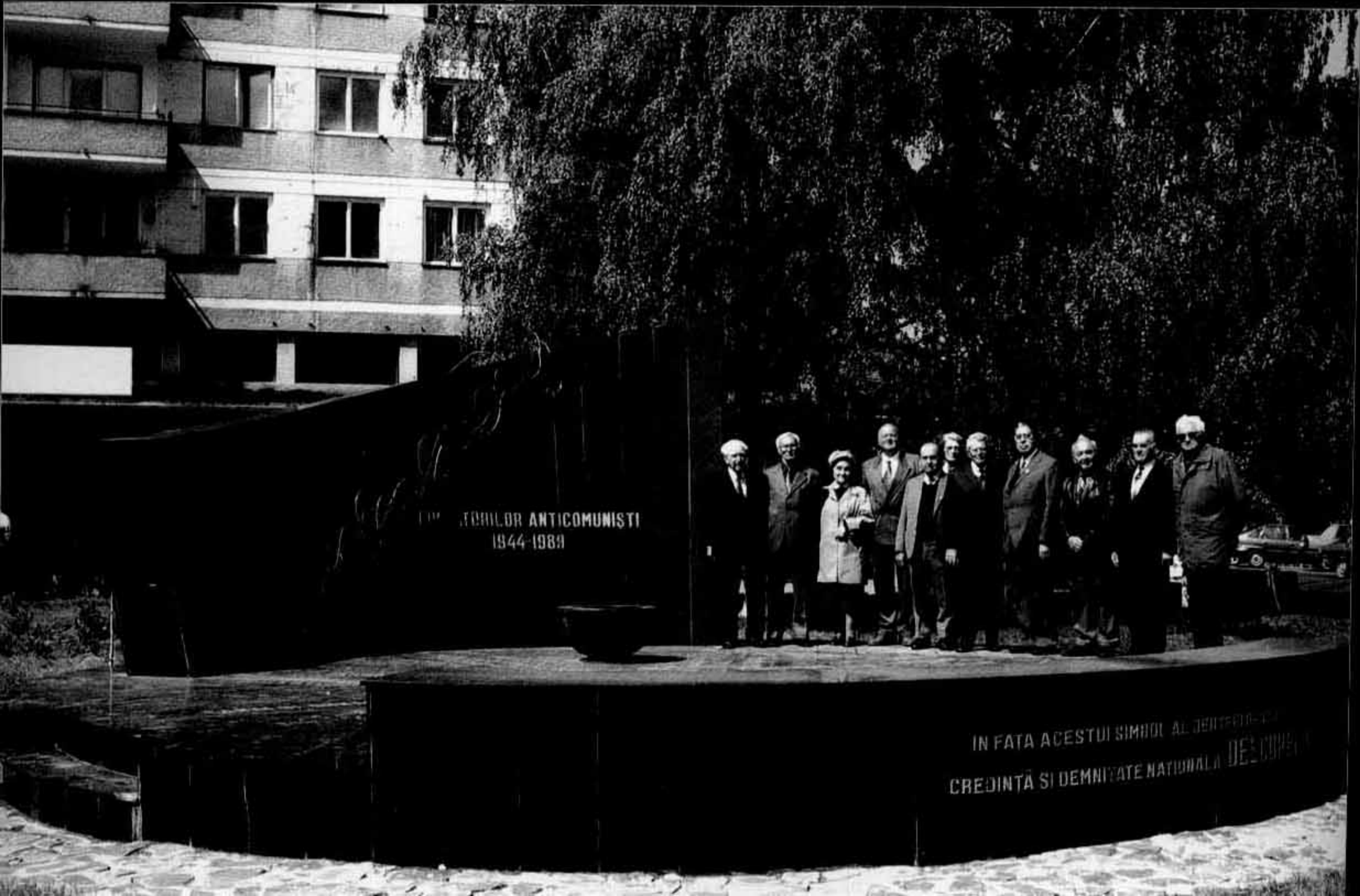
Monumentul de la Brașov, momentul inaugurării