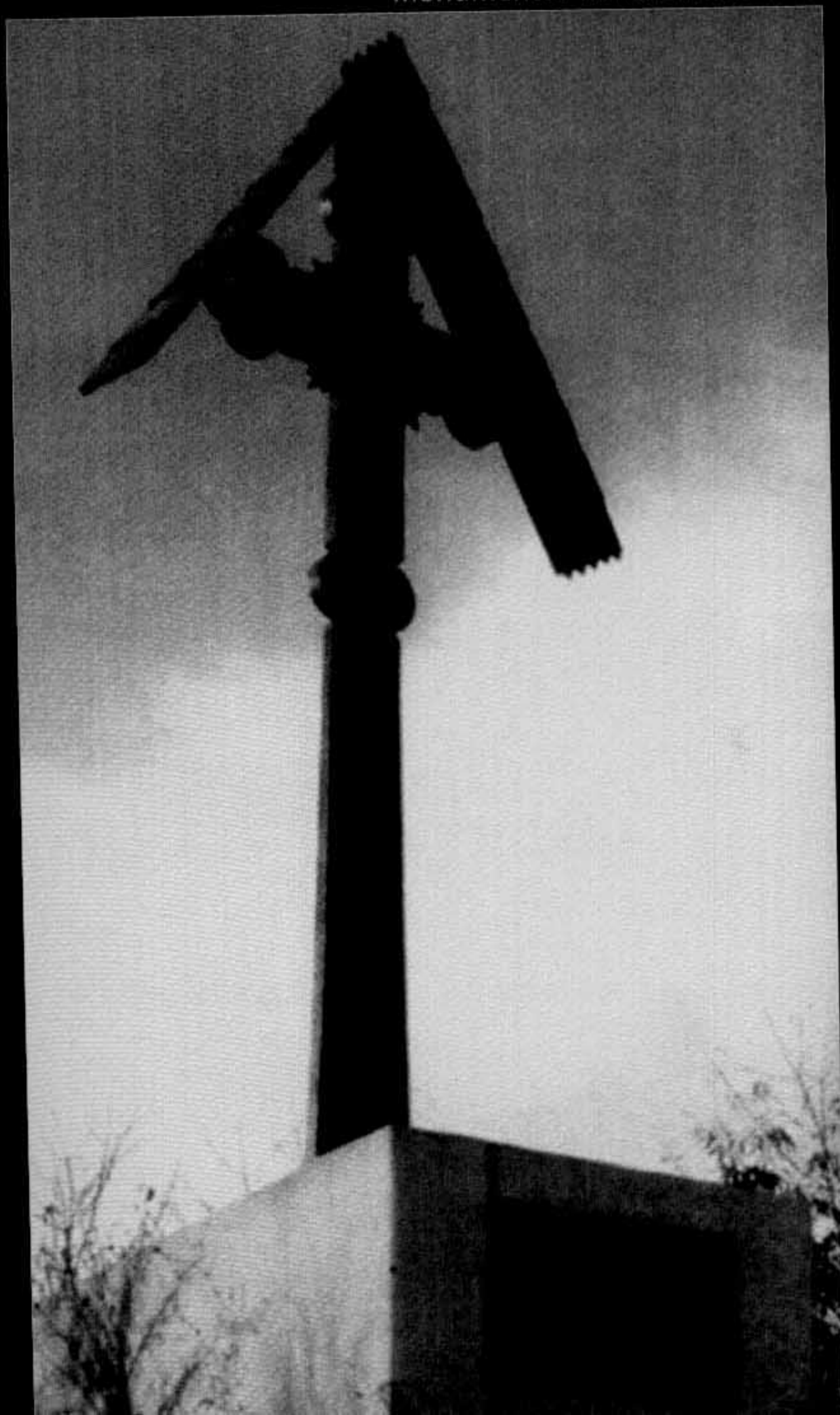
Monumentul 15 noiembrie 1987

Acest monument a fost expus în albumul memorial al AFDPR întrucât membrii de la „15 noiembrie 1987” sunt și membrii asociației noastre. Monumentul a fost ridicat din inițiativa și prin grija membrilor asociației „15 noiembrie 1987” pe Calea București din Brașov, adică pe traseul urmat de coloanele muncitorilor revoltați care se îndreptau spre județeană PCR din centrul orașului. Pe placa de marmură fixată la baza monumentului stau înscrise următoarele cuvinte: