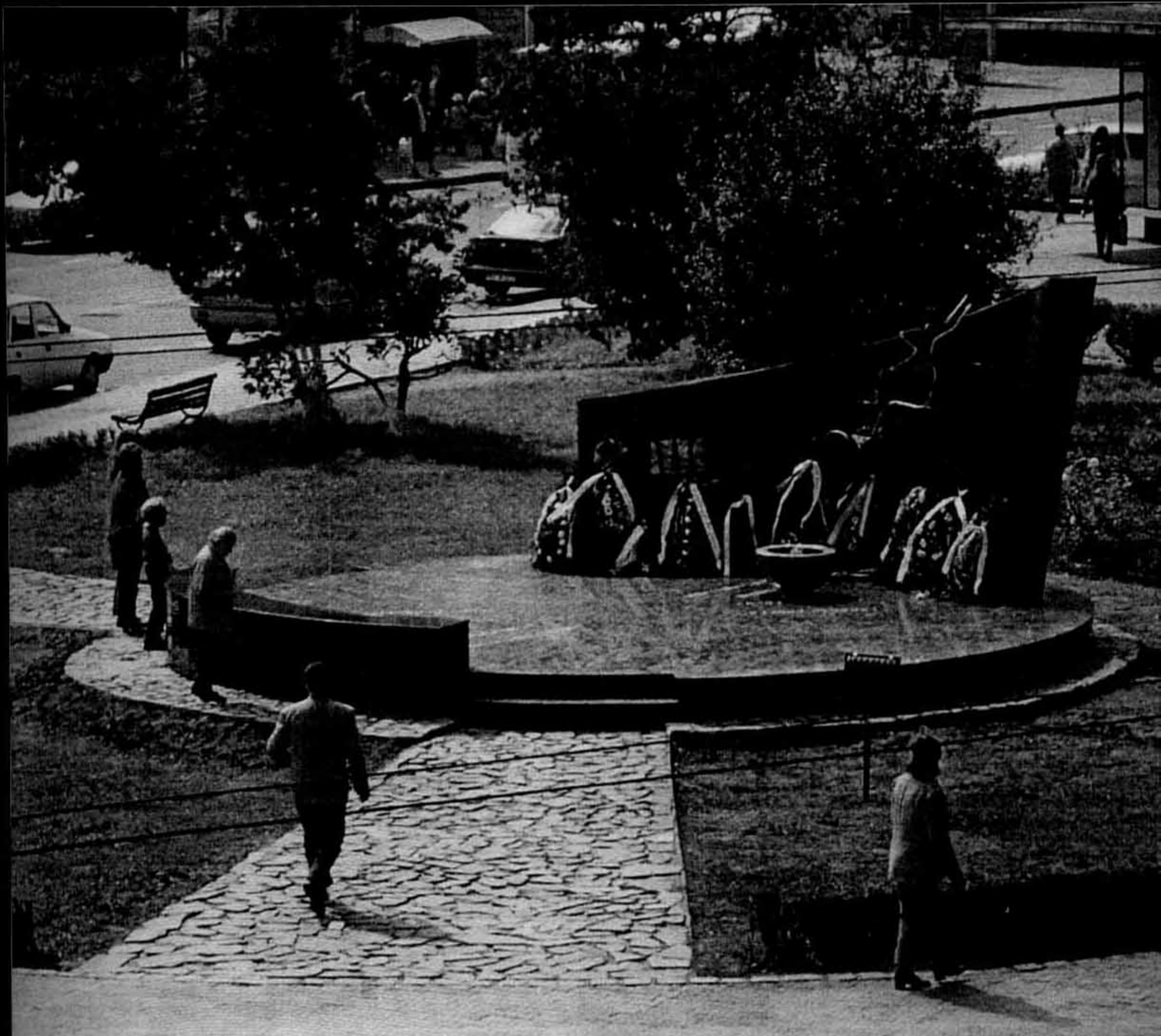
Memorialul de la Braşov