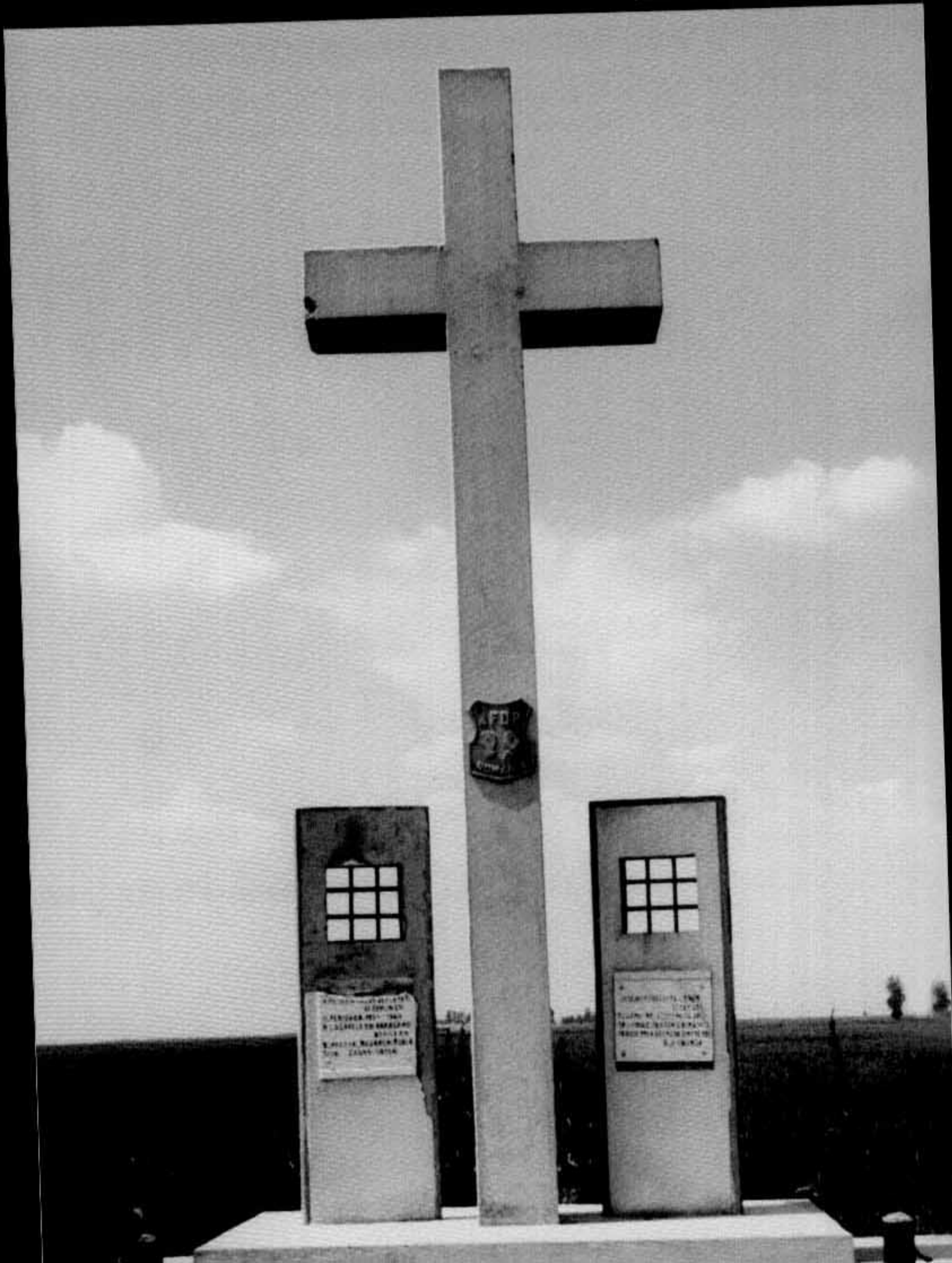
Monumentul de la Rubla