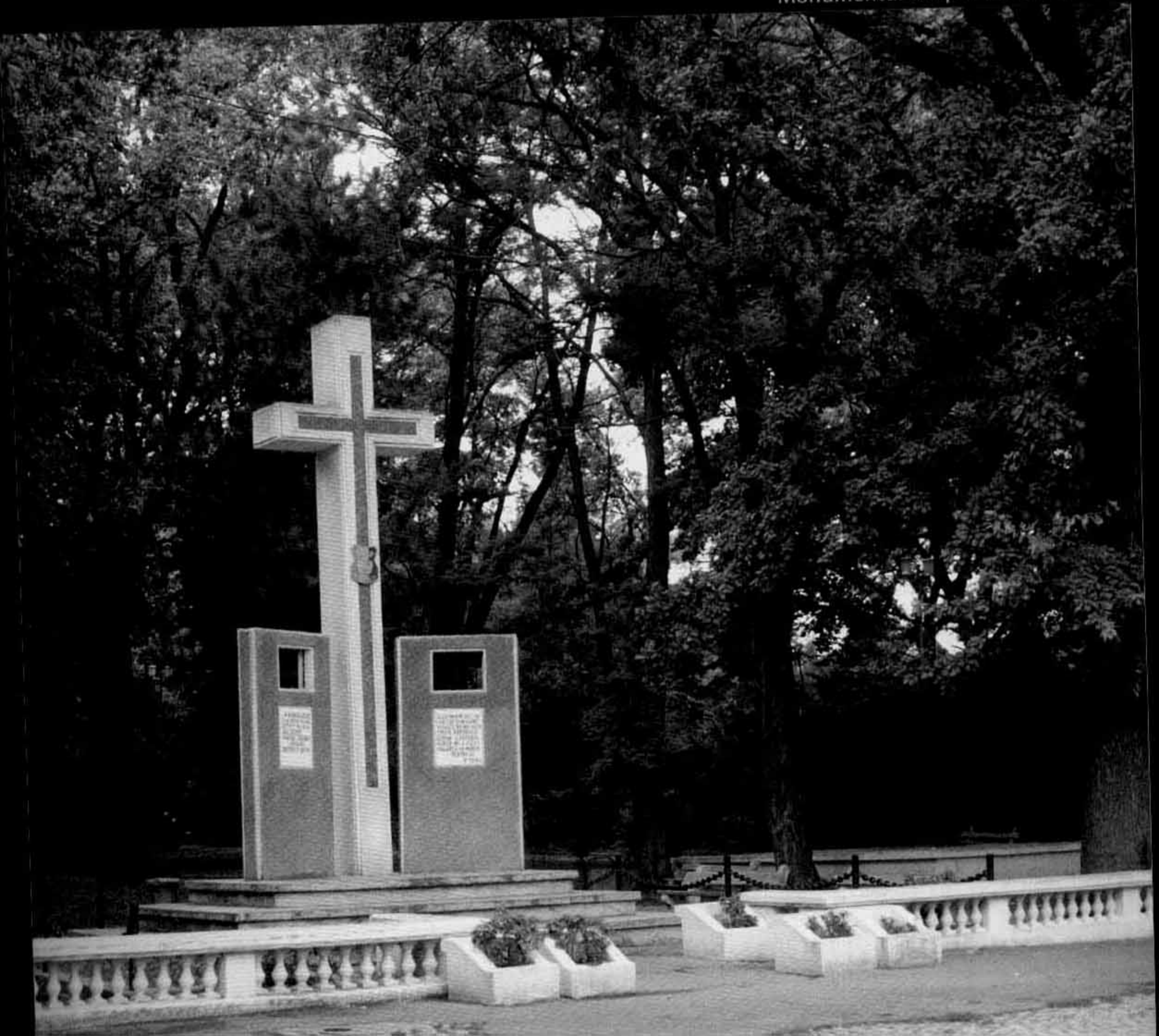
Monumentul din parcul central Braila