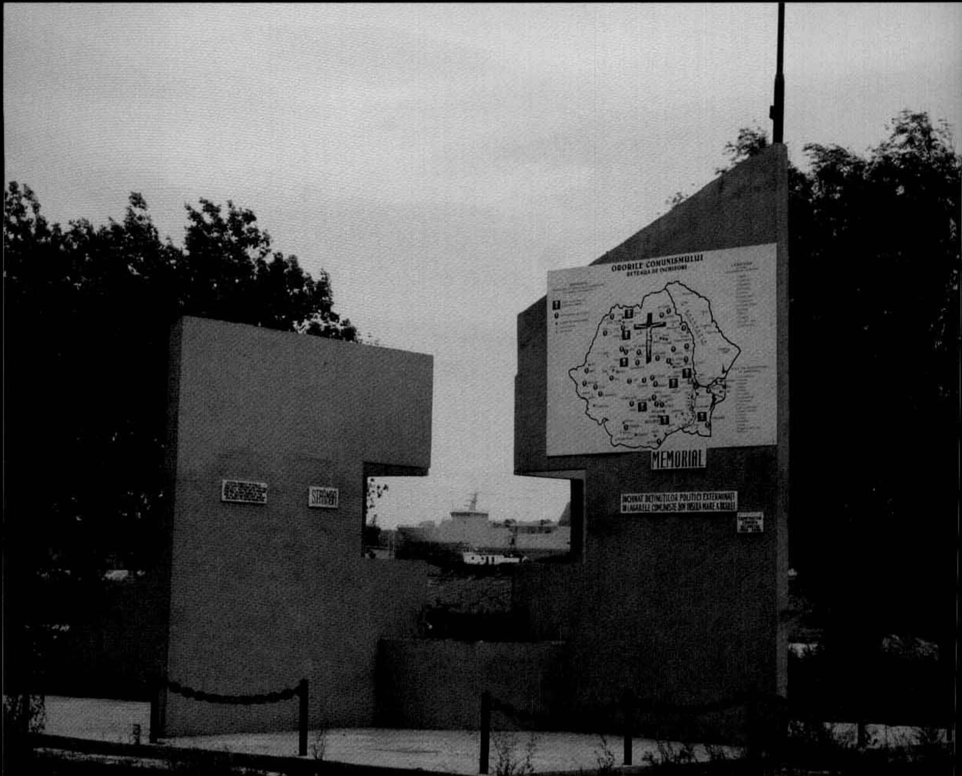
Memorialul din Insula Mare a Brăilei