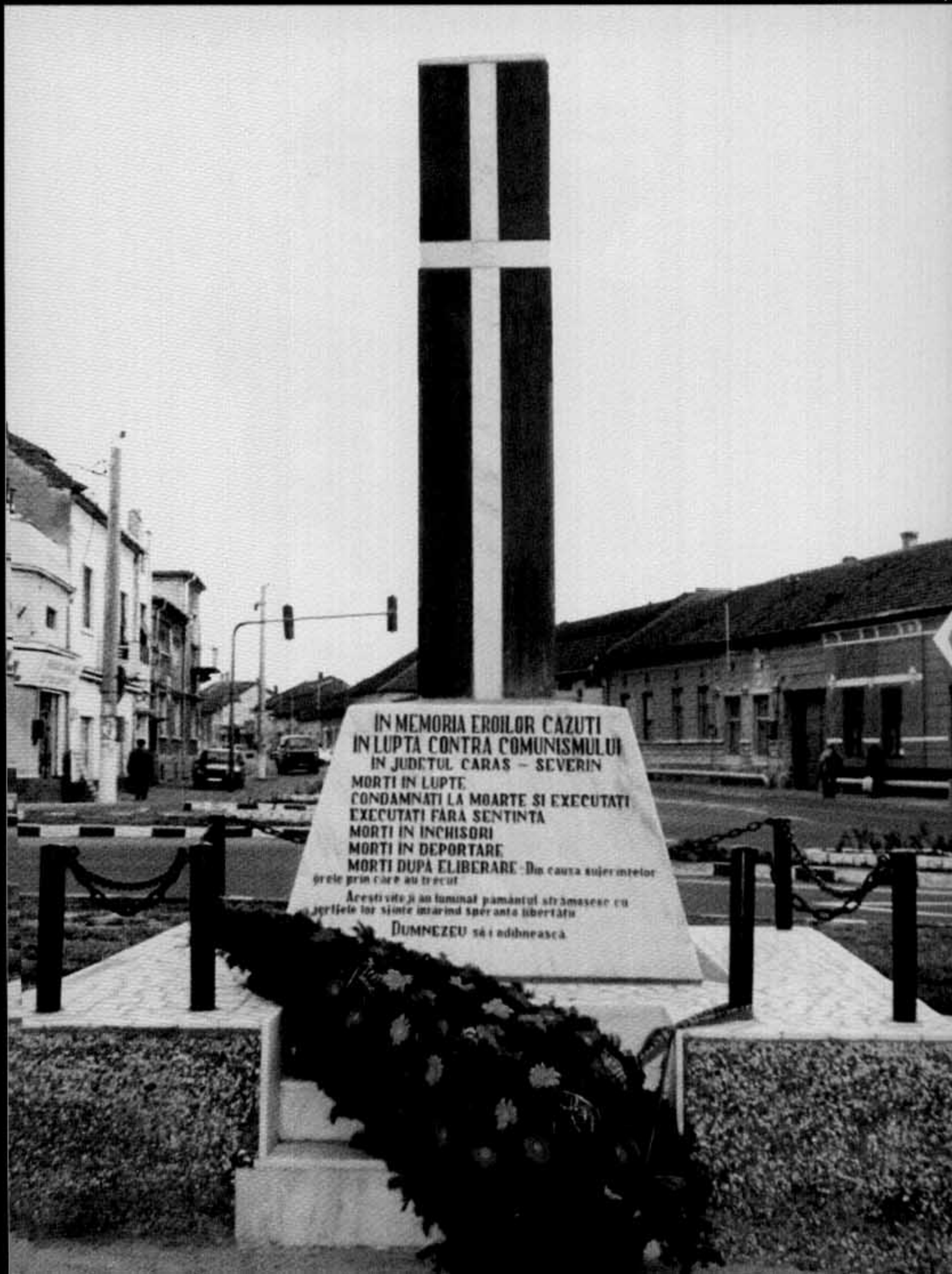
Monumentul de la Caransebeș