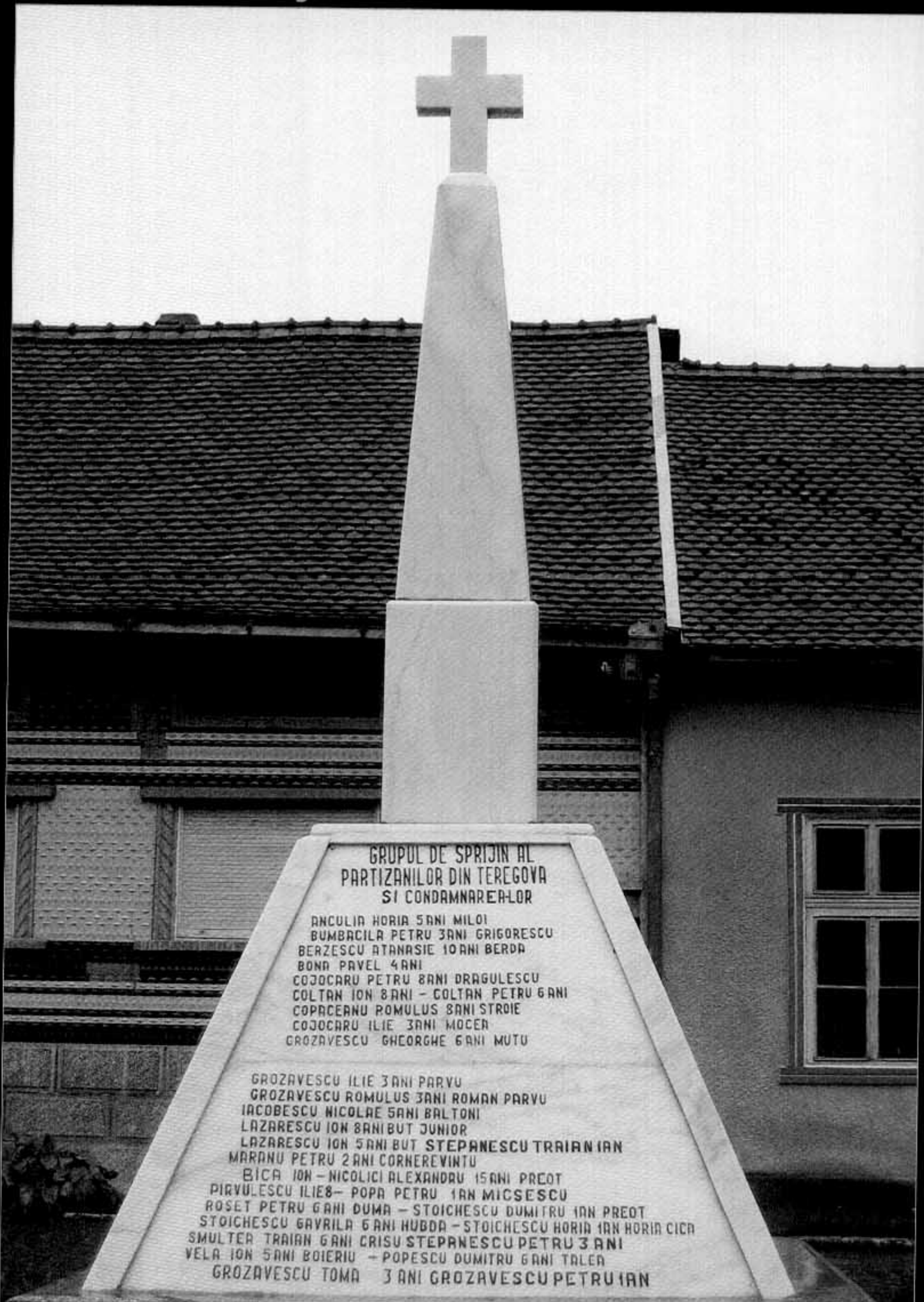
Monumentul de la Teregova