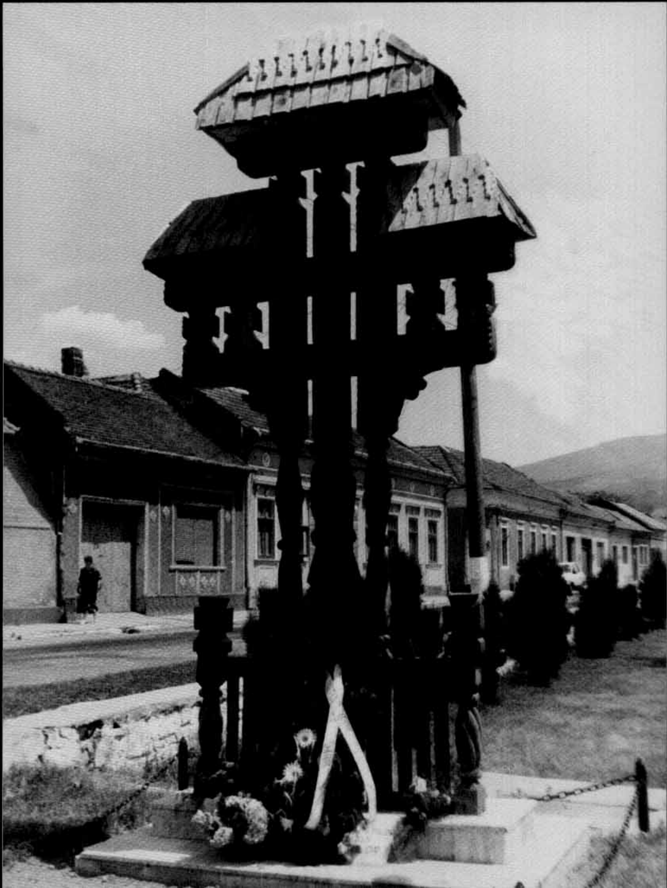
Monumentul de la Oravița