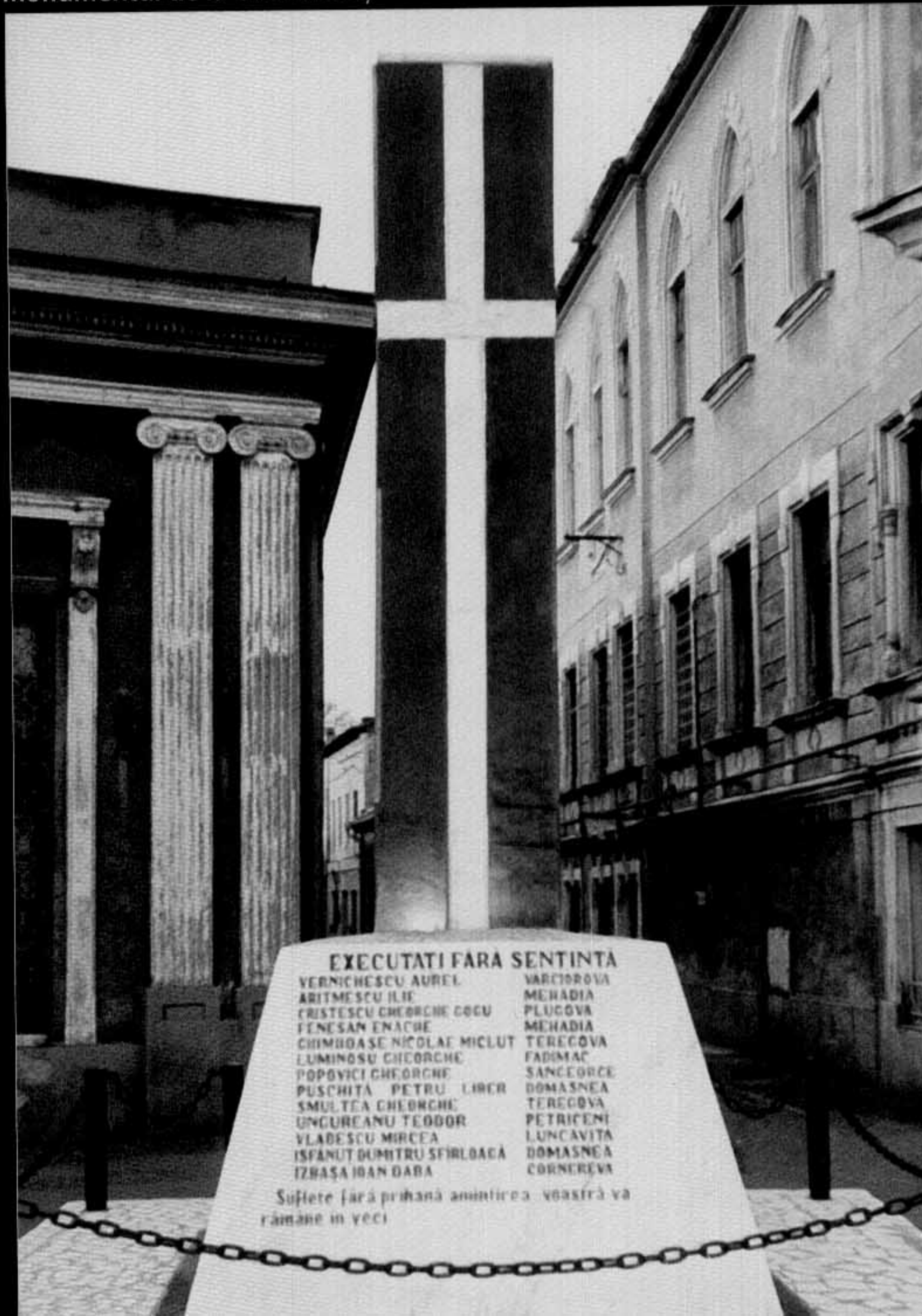
Monumentul de la Caransebeş