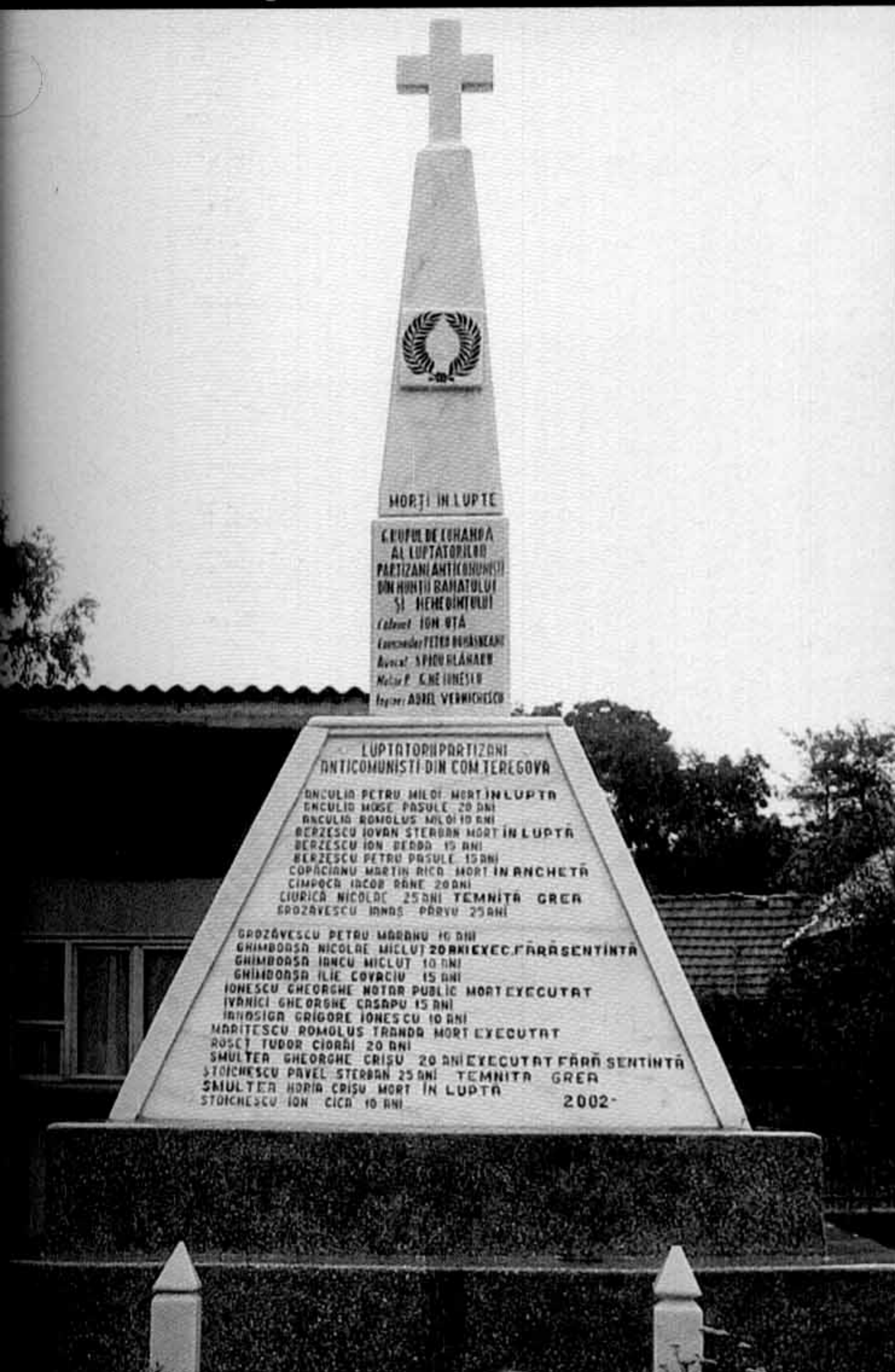
Monumentul de la Teregova

Pe soclul monumentului stă cioplit în piatră: