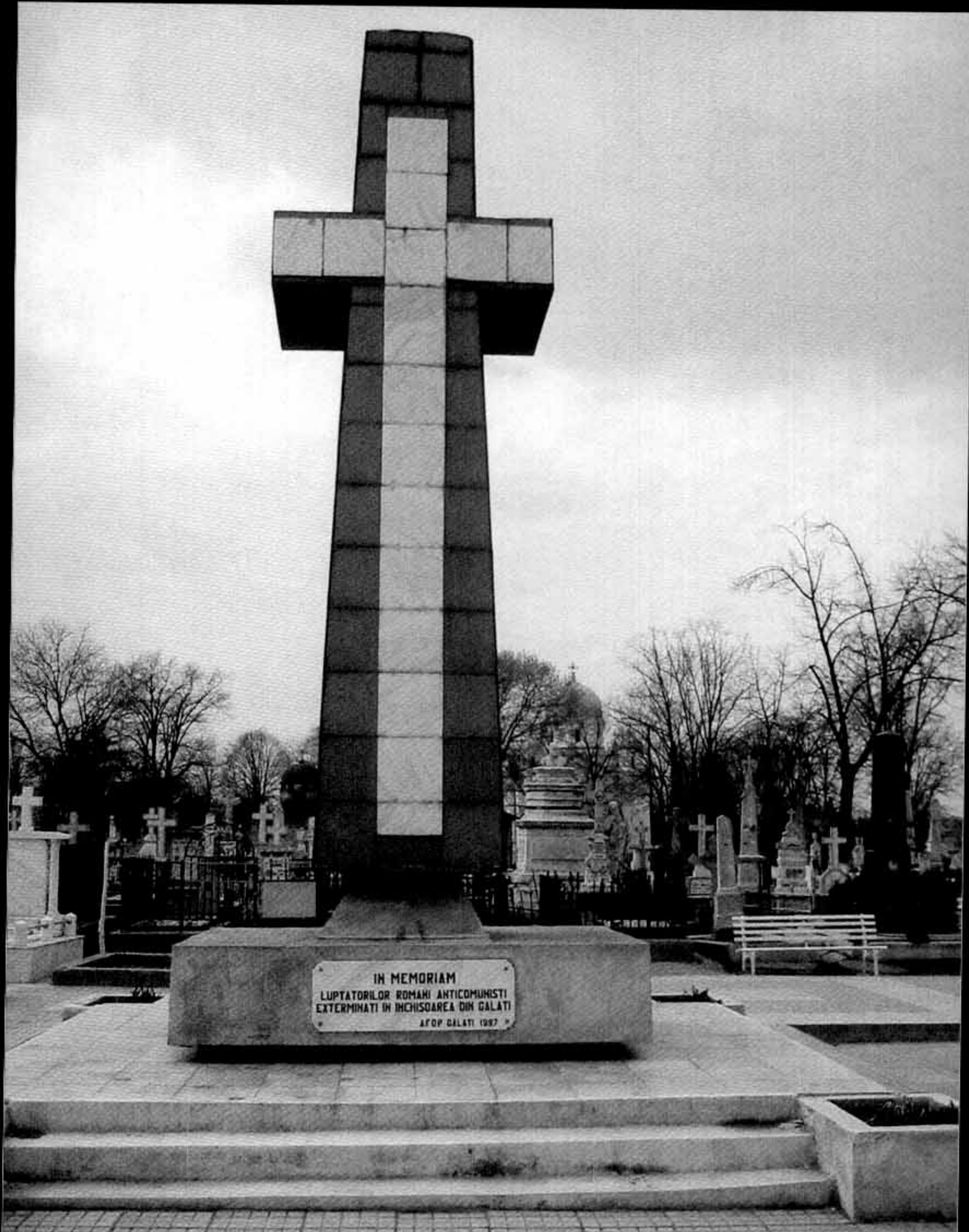
Monumentul de la Galați