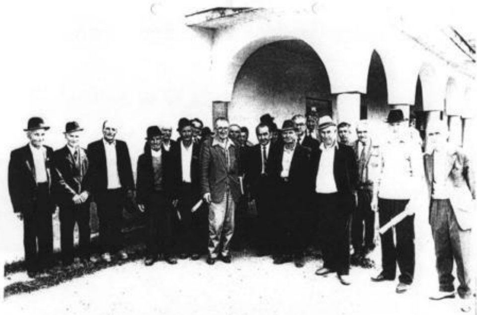
VISINA și RĂSCĂIETI In mijlocul tărănilor supraviețuitori, la Căminul Cultural după parastassul celor morți