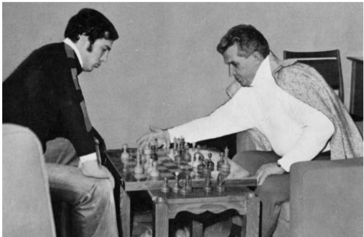
Șahist încercat în lupte revoluționare, tovarășul Nicolae Ceaușescu îi arată genialului său fiu, Nicu Ceaușescu, o serie de mutări de viitor.