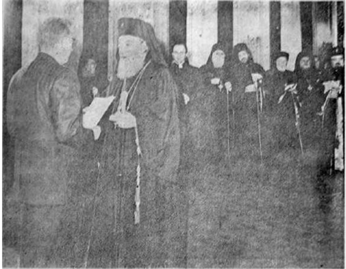
Dl. Manea Mănescu, vicepreședinte al Consiliului de Stat, înmînează I.P.S. Mitropolit Teoctist Arapașu, nou alesul patriarh al Bisericii Ortodoxe Române, Decretul prezidențial de recunoaștere în această demnitate

Mulțumindu-Vă cu profundă recunoștință pentru climatul de deplină libertate religioasă creat cultelor din țara noastră, ierarhii, clerul și credincioșii Bisericii Ortodoxe Române, într-un glas și o unică simțire cu întreaga noastră națiune, cu nobile sentimente de