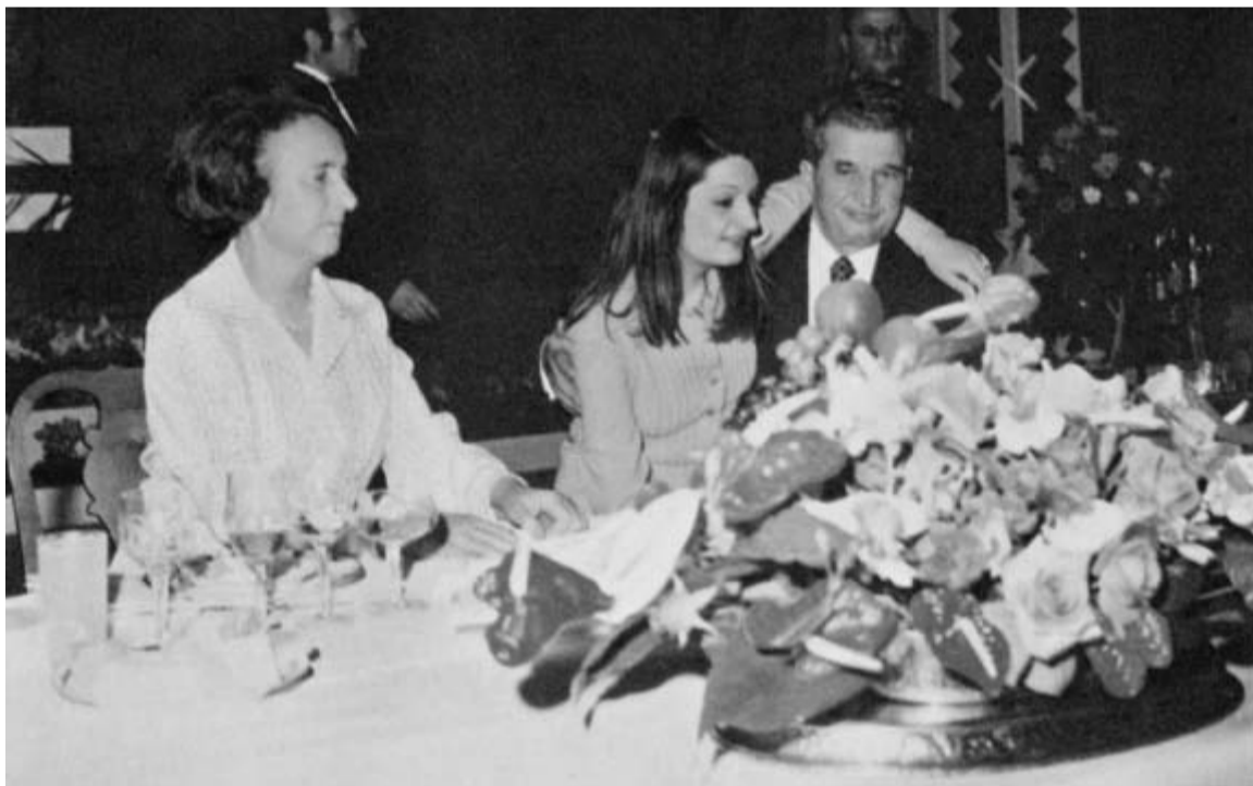
Tovarășa Elena Ceaușescu și tovarășul Nicolae Ceaușescu, părinții dragi ai națiunii, alături de unul din copiii lor

Șeful comisiei culturale a Consiliului UASC din Centrul Universitar București