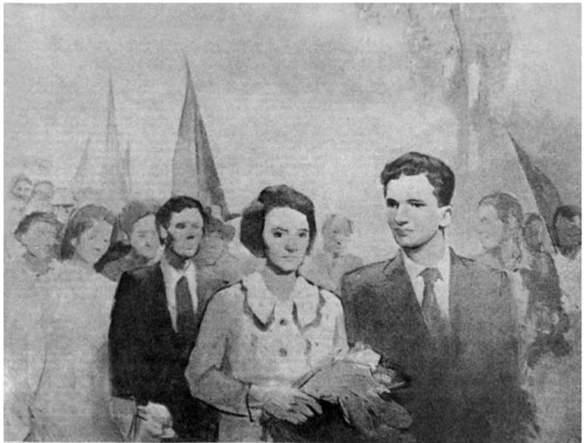
EUGEN PALADE: 1 Mai 1939