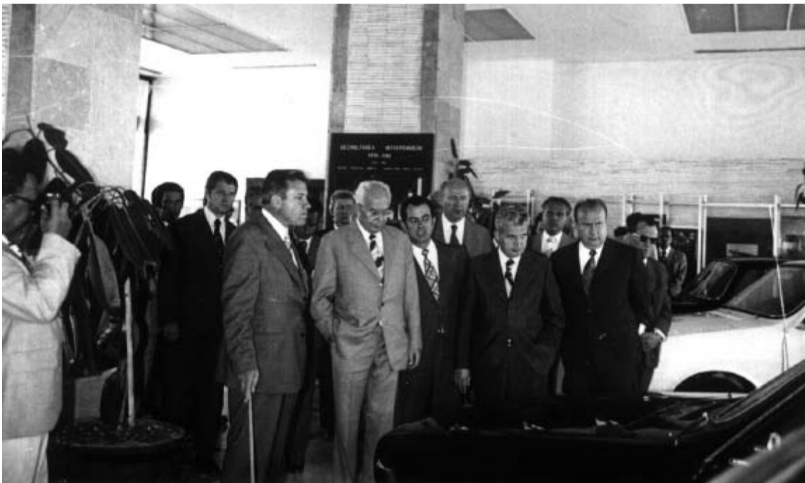
Vizită de lucru pe platforma industrială Uzinele Dacia din Pitești, minunat prilej pentru tovarășul Nicolae Ceaușescu de a asista la o schimbare de ulei.

THEODOR STOLOJAN economist în Ministerul Finanțelor